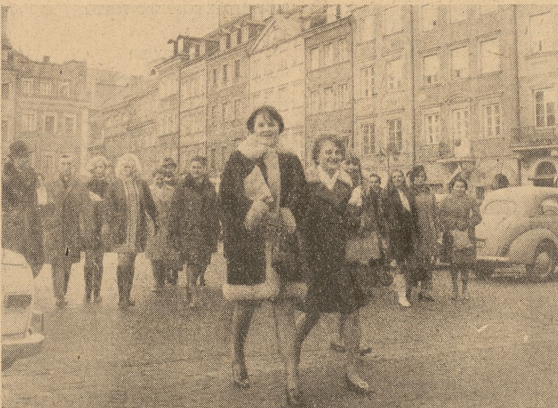
▲ jeśli zwiedzanie Warszawy — to „obowiązkowo” Stare Miasto.