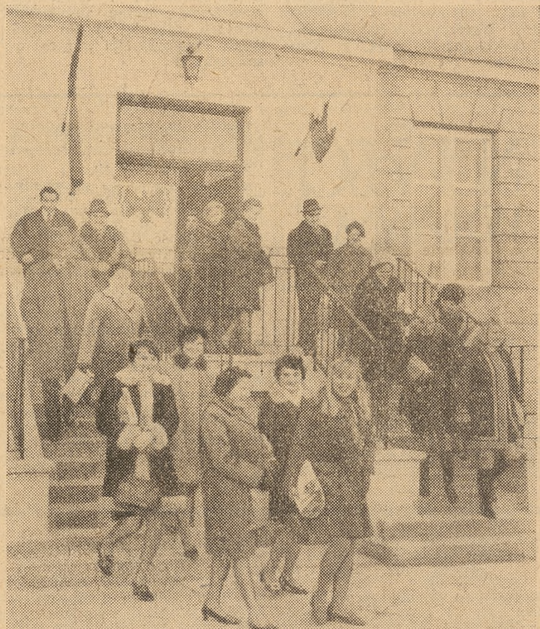
Po spotkaniu w Domu Nauczyciela — spacerkiem na obiad.