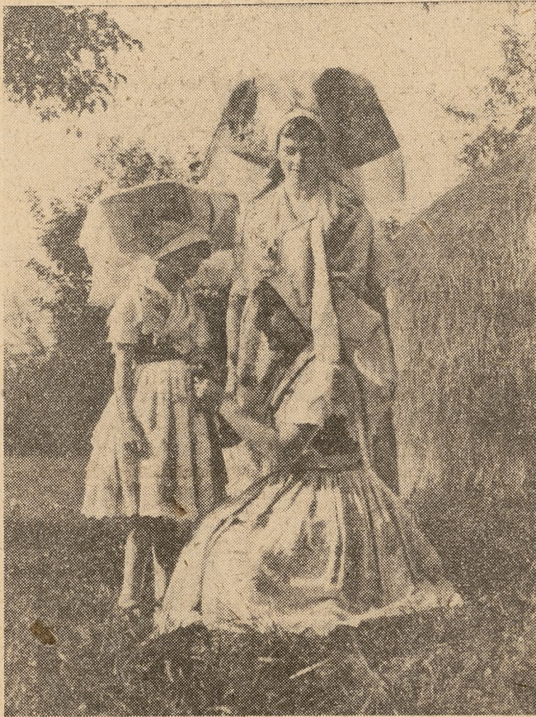
Dziewczeta w serbskich strojach

Informacje, ale bardzo głębokie przeżycia, gdy polski nauczyciel historii serbołużyckiemu koledze — nauczycielowi pokazywał podziemne przejścia i piwnice, w których sam walczył i lochy katowni na Pawiaku, gdzie polscy patrioci byli masowo torturowani i mordowani, gdzie cierpiano pod nieludzką władzą niemieckich faszystów.