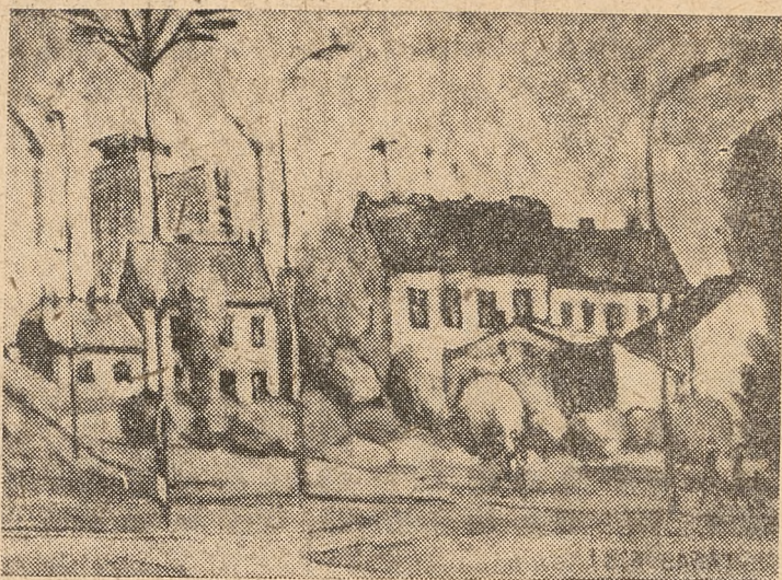
Lech Łabaj — Rzeszów