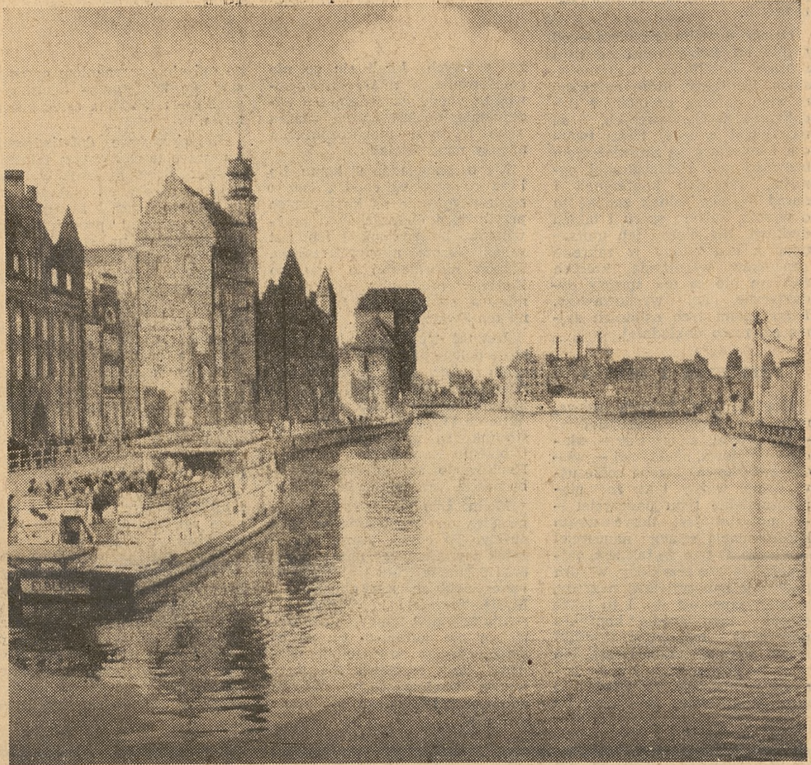
Gdańsk — dzielnica portowa