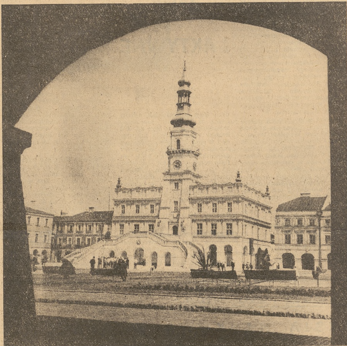
Ratusz w Zamościu

Ta ścisła integracja poczyniła istnieć nie tylko między ogniwami ZNP i władzami oświatowymi, ale również wewnątrz samej organizacji związkowej. Mamy tu na myśli członków ZNP pracujących w szkolnictwie wyższym i szkolnictwie podstawowym oraz średnim. Dzięki takiej atmosferze udało się w okręgu lubelskim przeprowadzić skutecznie wiele niezwykle cennych prac. Od pięciu lat prowadzi się tzw. eksperyment lubelski, który skupia około 3 tysięcy nauczycieli pracujących zespołowo i indywidualnie nad wybranymi przez siebie problemami w 180 szkołach wiodących i w klubach nauczycielskich. Poza tym w 30 szkołach około 400 nauczycieli pod bezpośrednim kierownictwem, opieką naukową pracowników Uniwersytetu im. Marii Curie-Skłodowskiej i Warszawskiego, lubelskiej WSR oraz Instytutu Pedagogicznego w Warszawie prowadzi eksperymenty pedagogiczne. Niezależnie od tego w tzw. eksperymencie puławskim uczestniczą wszystkie szkoły tego powiatu z liczbą około 600 nauczycieli.