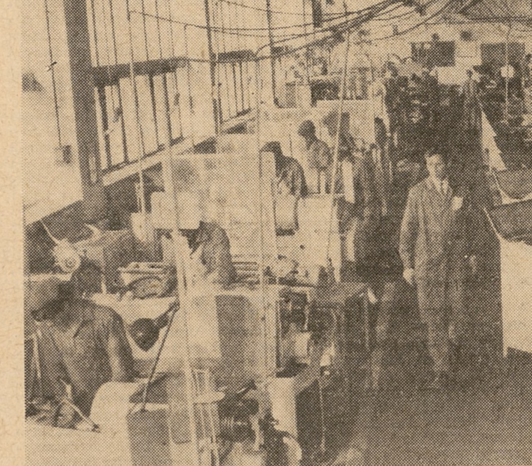
W ZSZ dla młodzieży w Żerańskim Zakładzie Przemysłowym w Krakowie. W tle: dyrektor zakładu, sekretarz propagandy POP, przewodniczący Rady Zakładowej.

Ta racjonalna hojność oplaca się FSO. W zamian otrzymuje dobre wykwalifikowanych pracowników