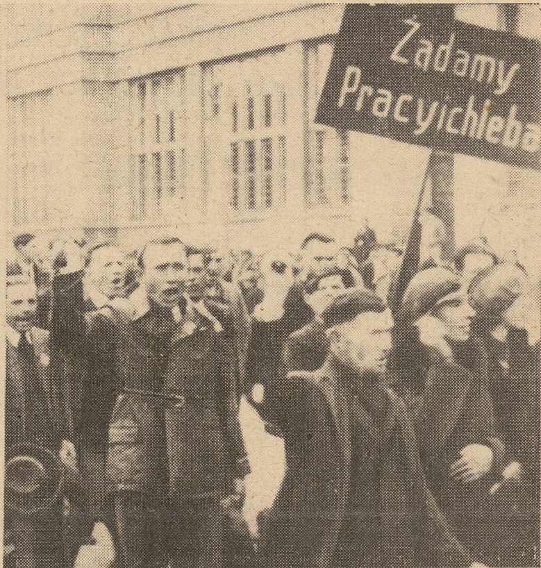
Jedna ze scen ulicznych w okresie walki z sanacją