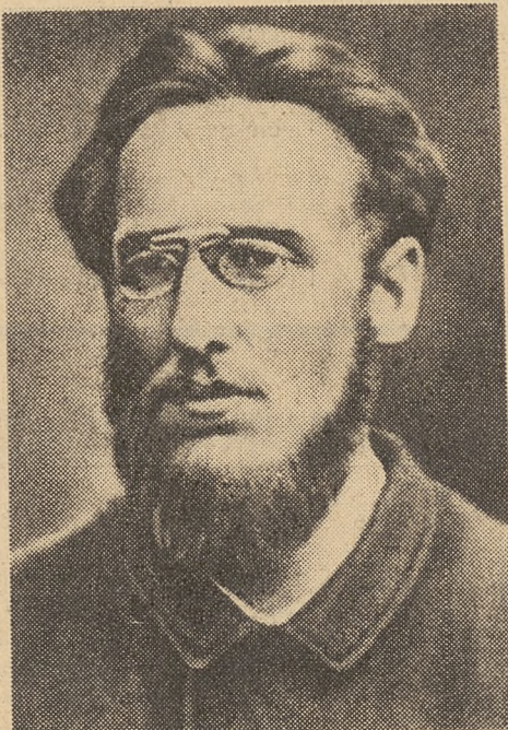
Ludwik Waryński — twórca „Proletariatu”

W tym samym czasie powstaje Polska Partia Socjalistyczna, utworzona na zjeździe paryskim w 1892 roku. U podstaw