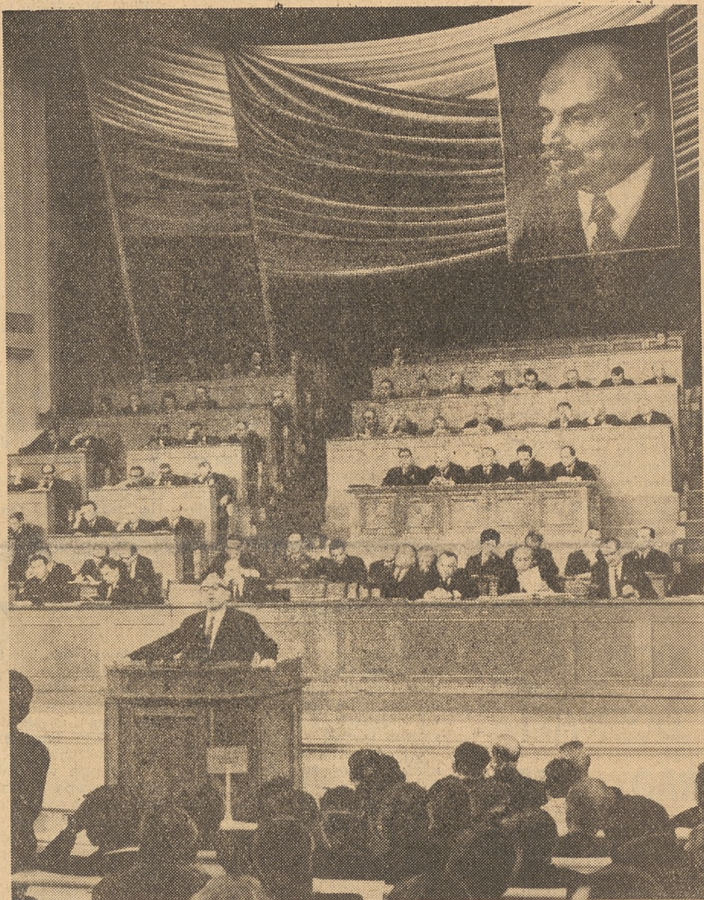
Prezydium V Zjazdu Polskiej Zjednoczonej Partii Robotniczej

Głównym wydarzeniem pierwszego dnia obrad było przemówienie wprowadzające do dyskusji, wygłoszone przez I Sekretarza KC PZPR Władysława Gomułę.