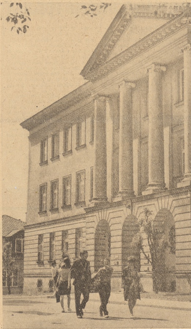
Na dziedzińcu Uniwersytetu Warszawskiego