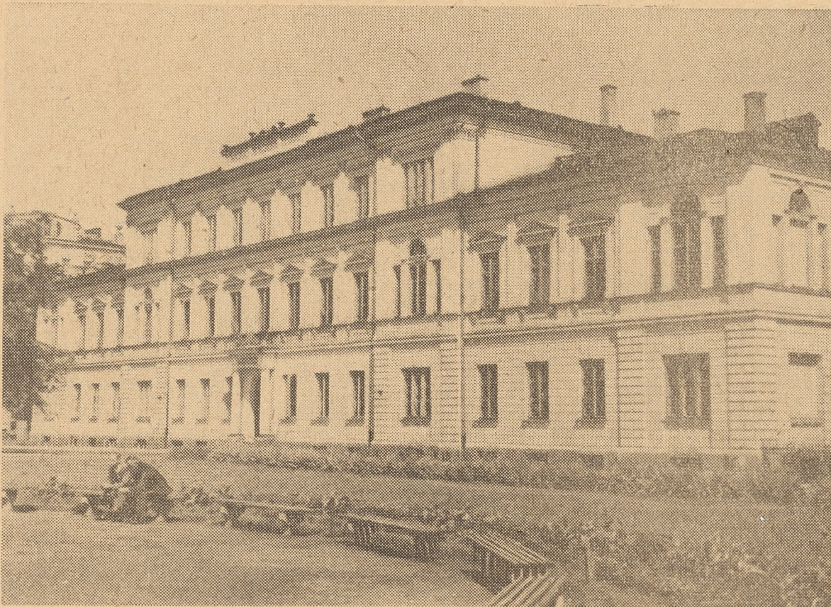
Gmach Uniwersytetu im. Marii Curie-Skłodowskiej w Lublinie

Jesienna konferencja, zorganizowana w Zakopanem w dniach 3-14 września bieżącego roku przez Sekcję Nauki ZG ZNP, poświęcona była aktualnym problemom szkół wyższych i instytutów naukowo-badawczych.