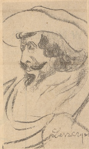
Wybitny aktor Bogusław Leszczyński — z cyklu „Teatr warszawski XIX w”

Znaczenie wystawy, eksponowanej w gmachu ZG ZNP, jest tym większe, że stanowi ona dalszy, bardzo istotny krok na drodze do ściślejszej współpracy pomiędzy „Ruchem” a Związkiem Nauczycielstwa Folskiego i szerszym kręgiem pedagogów. Ze