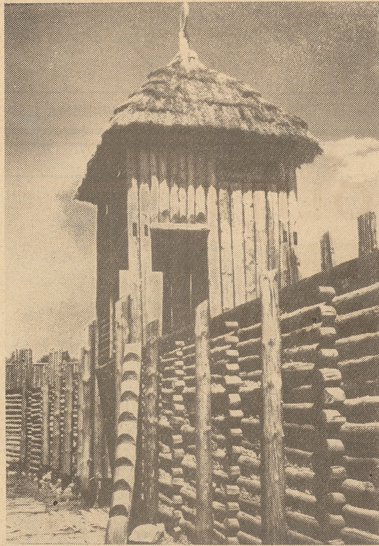
Biskupin. Część zrekonstruowanego „muru” obronnego z bramą-wieżą sprzed 2500 lat.

pocztówki ukazujące ptaki Ameryki, Australii, Afryki i innych lądów; rośliny lecznicze, owoce południowe, owoce tropikalne, rośliny przemysłowe, rośliny ozdobne, motyle egzotyczne, owady wodne, pszczoły, ssaki chronione, faunę Puszczy Białowieskiej itp. dziedziny zoologii i botaniki.