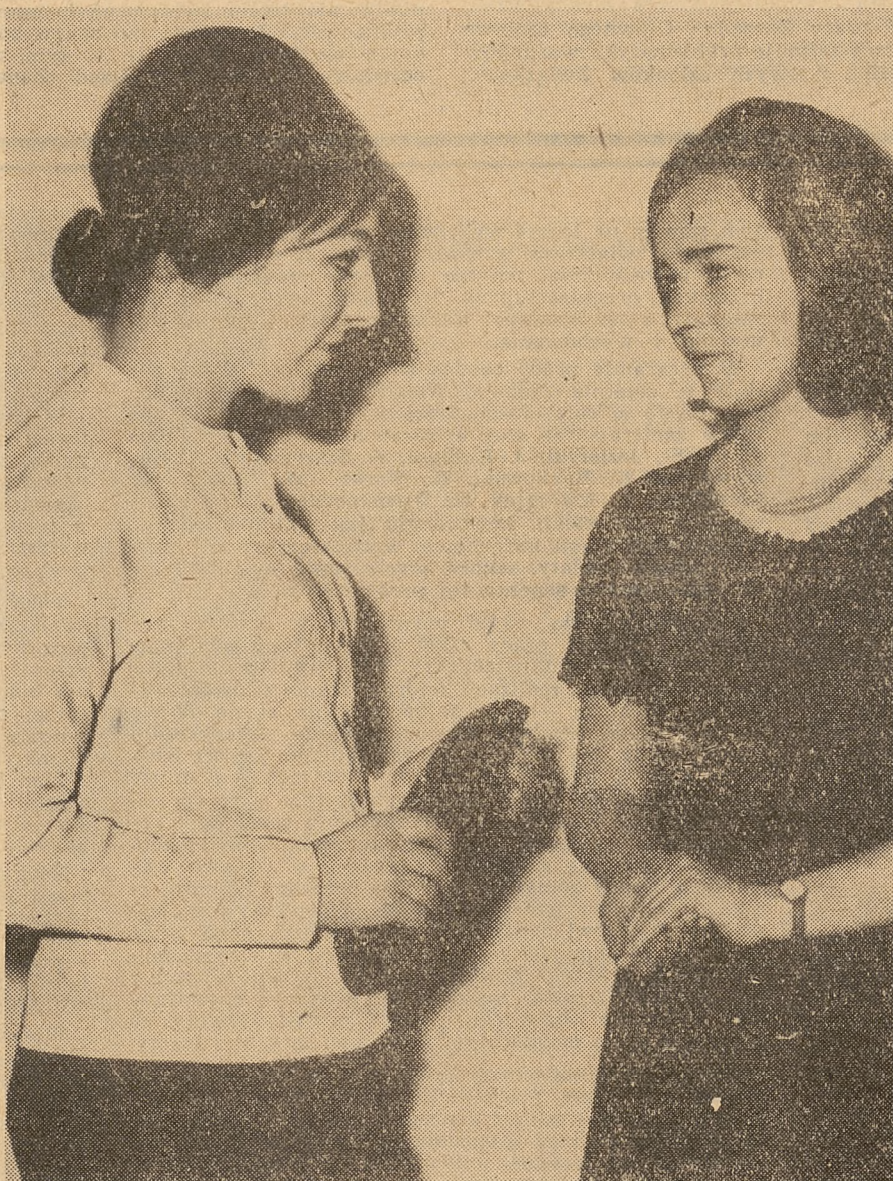
Dyskusja toczyła się nawet w przerwie — uczestniczki spotkania znalazły niejedną wspólny temat.

Od charakteru pierwszych kontaktów ze Związkiem zależy przecież tak wiele, a przede wszystkim pełne wprowadzenie młodych do pracy, pomoc w ustabilizowaniu ich, trwałe związanie ze szkołami i z zawodem.