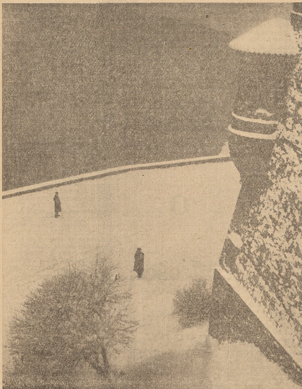
Widok z Wawelu na Wisłę.