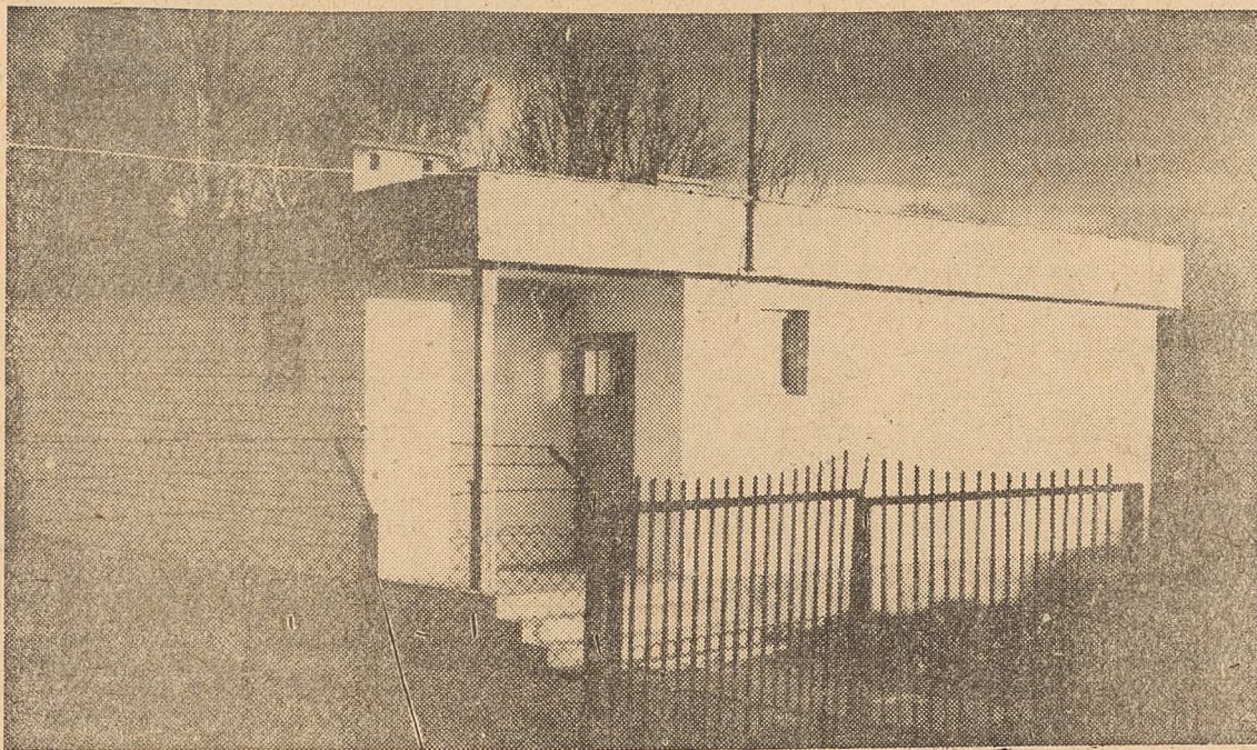
Domek w Staroźrebach

Zanim w redakcji zapadła decyzja o tej wizycie, wiedzieliśmy o Płocku, że buduje się tam dla wiejskich nauczycieli całkiem udane domki, a rozmach, z jakim się to robi, nie ma sobie równego w całym kraju. Obowiązkiem reportera było sprawdzić prawdziwość tych informacji. Tak oto jednego z listopadowych poranków auto redakcyjne przekroczyło granicę wielkiej Warszawy wzięło kierunek na Płock.