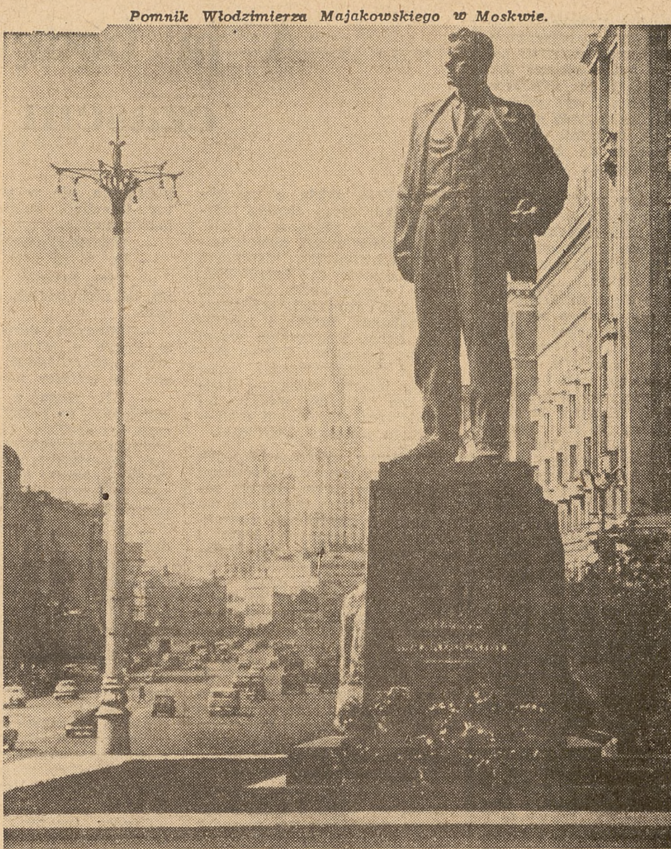
Pomnik Włodzimierza Majakowskiego w Moskwie.

Starca nam jeszcze czasu, by obejrzeć wiele innych interesujących budowli Moskwy, by przynajmniej z okien autokaru spojrzeć na ciekawskie pomniki, by przejechać się moskiewskim metro, być w kinie cineramicznym (jednym z trzech na świecie), a jednego z wieczorów obejrzeć świetny, wspaniale wystawiony, ba-