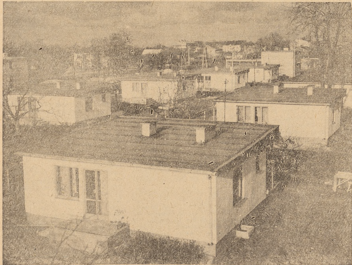
Osiedle w Drobinie