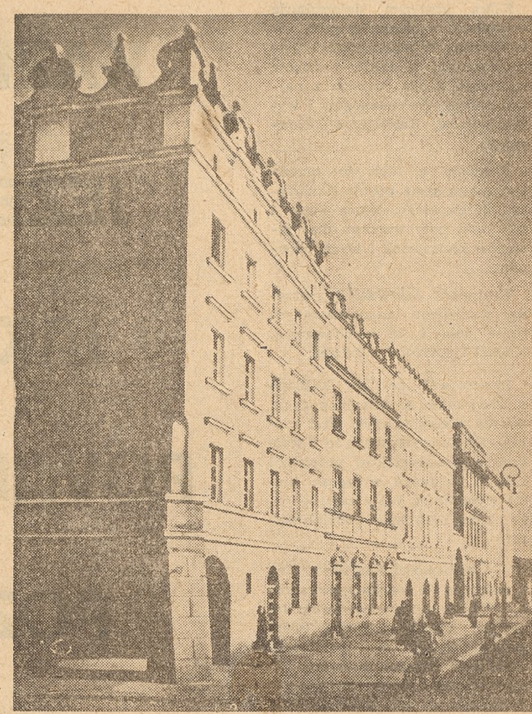
Raciborz — fragment śródmieścia