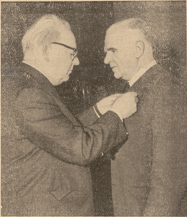
Sekretarz KC PZPR Witold Jarosiński przyjmuje, z rąk ministra oświaty i szkolnictwa wyższego Henryka Jabłońskiego — Medal Komisji Edukacji Narodowej