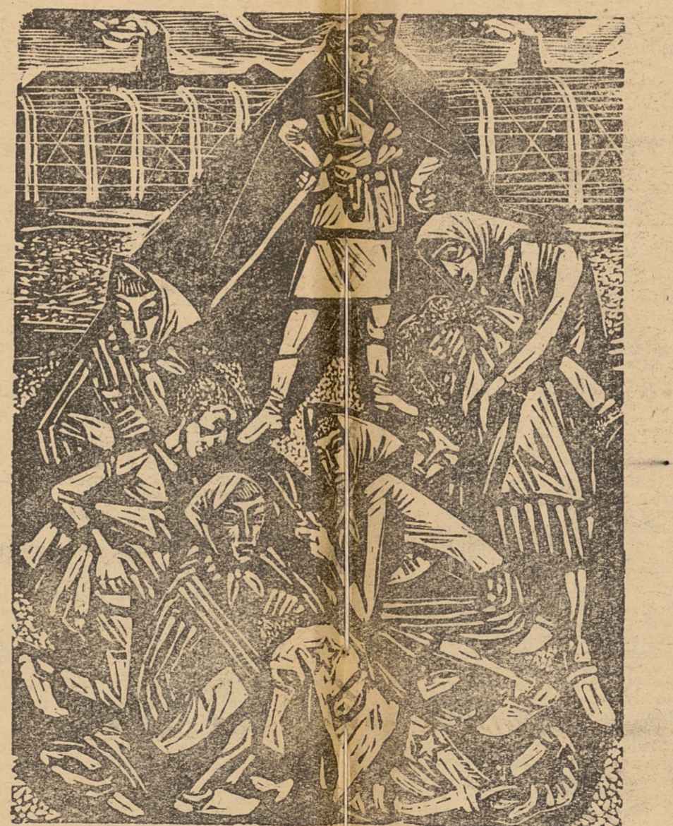
Więźniarki przy pracy

Nową gospodynią Halońa, uosobienie spokoju i odwagi, świadczą na rzecz konspiracji niemałe usługi.