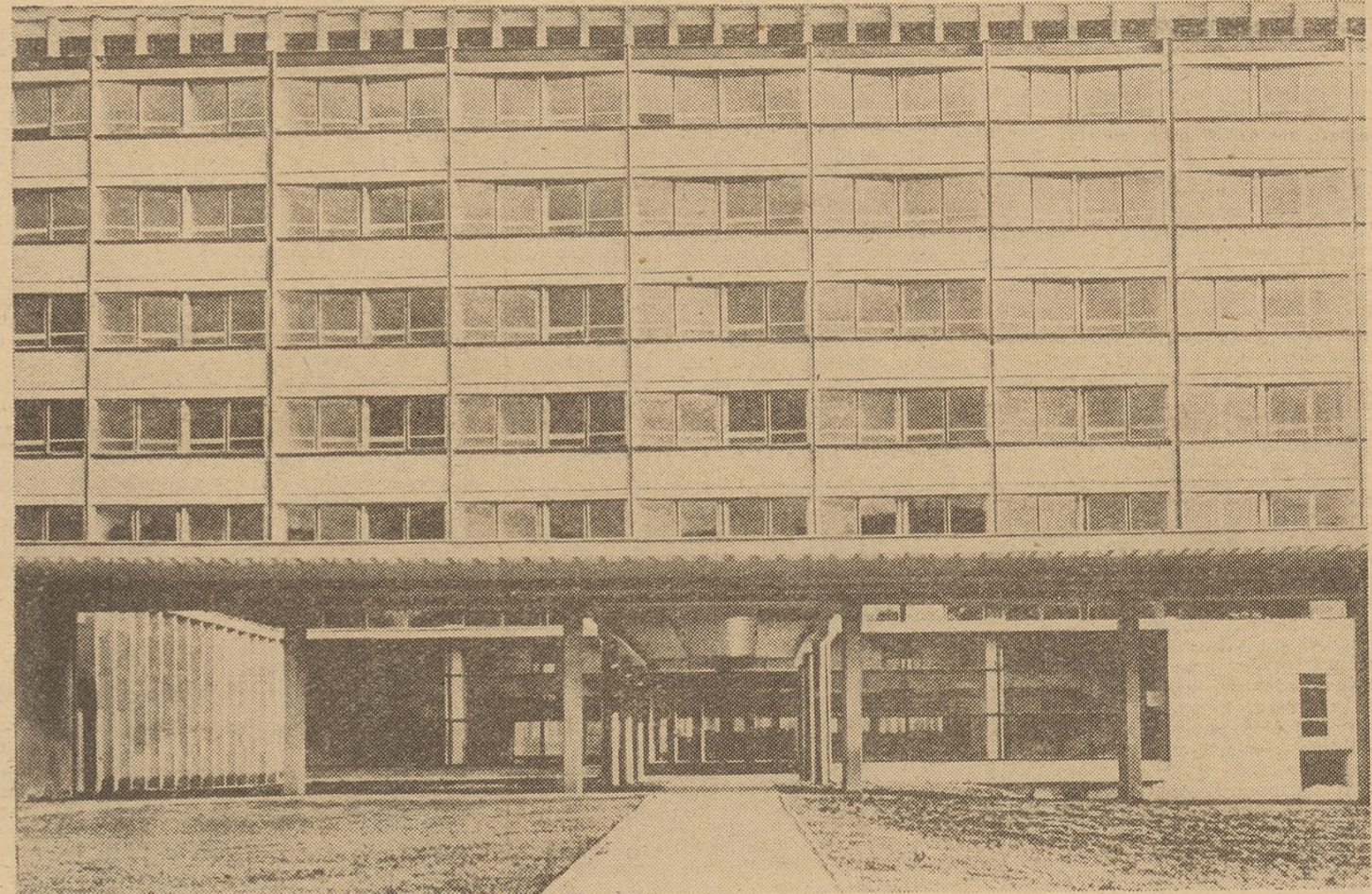
Collegium Phisicum Uniwersytetu Jagiellońskiego

iając pilną konieczność opracowania dla nich ramowych programów. Niepokojącym zjawiskiem występującym coraz jaskrawiej jest sprawa zatrudnienia doktorantów. Instytuty we własnym zakresie rozwiązują jej nie mogą.