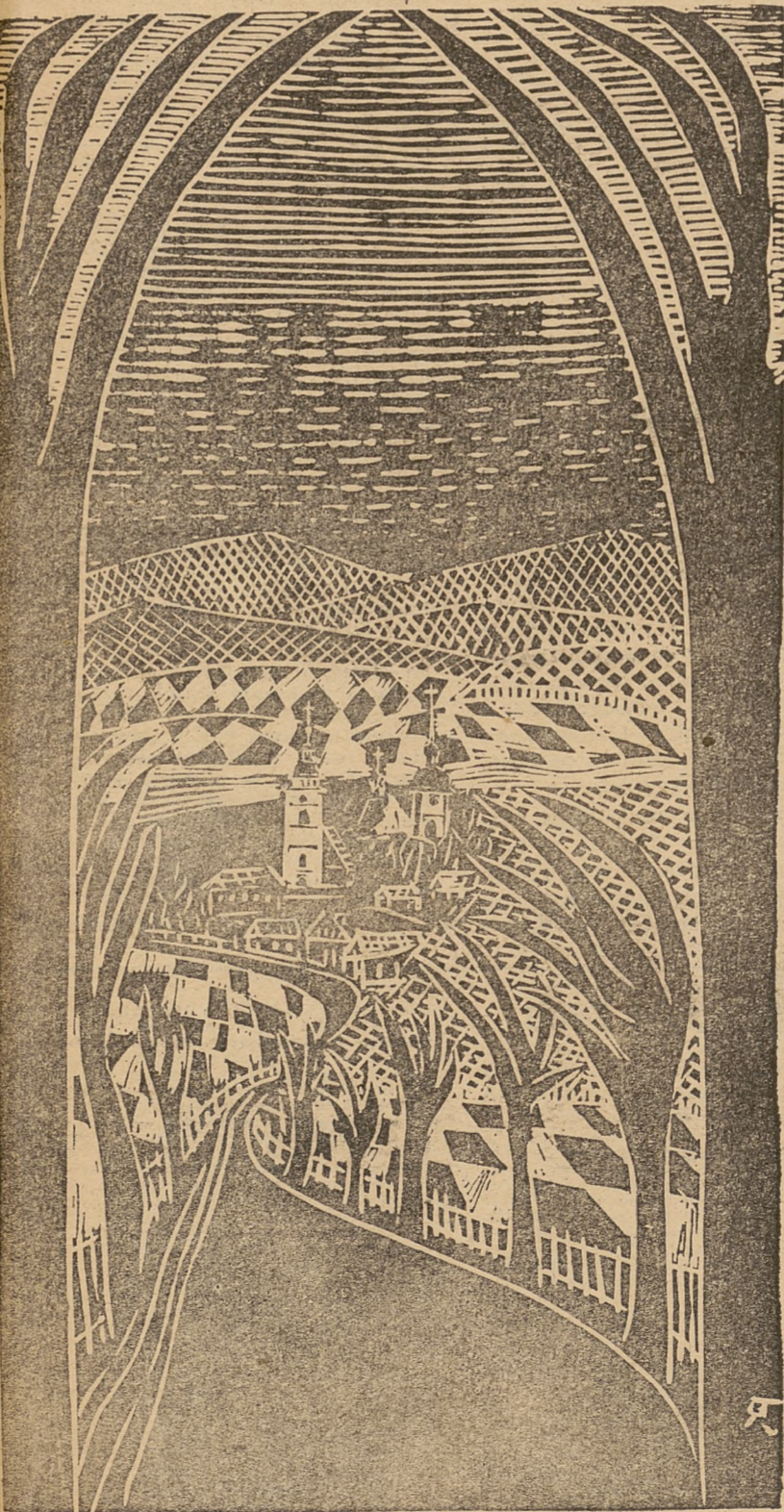
Z twórczości nauczycieli. Stary Sącz.