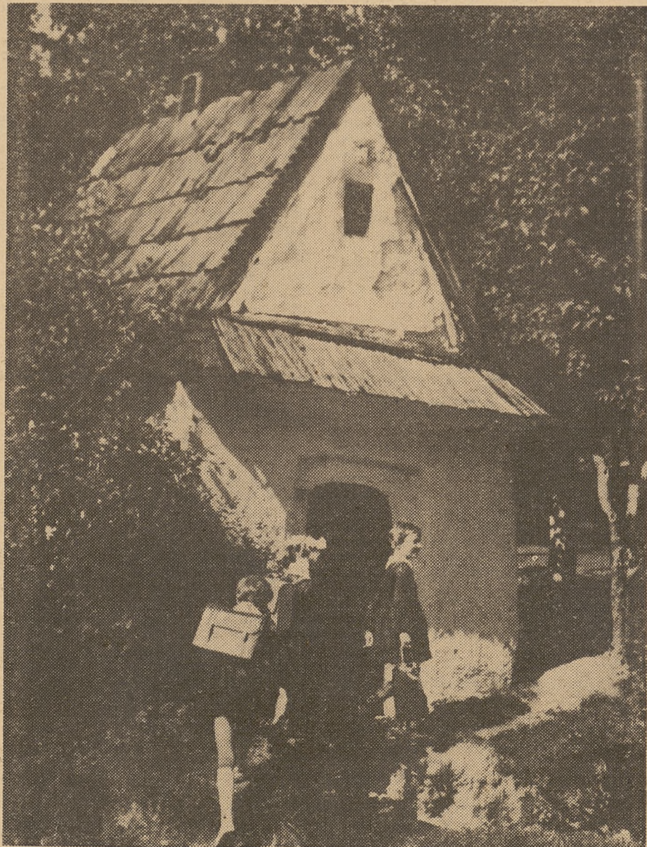
Droga do szkoły...