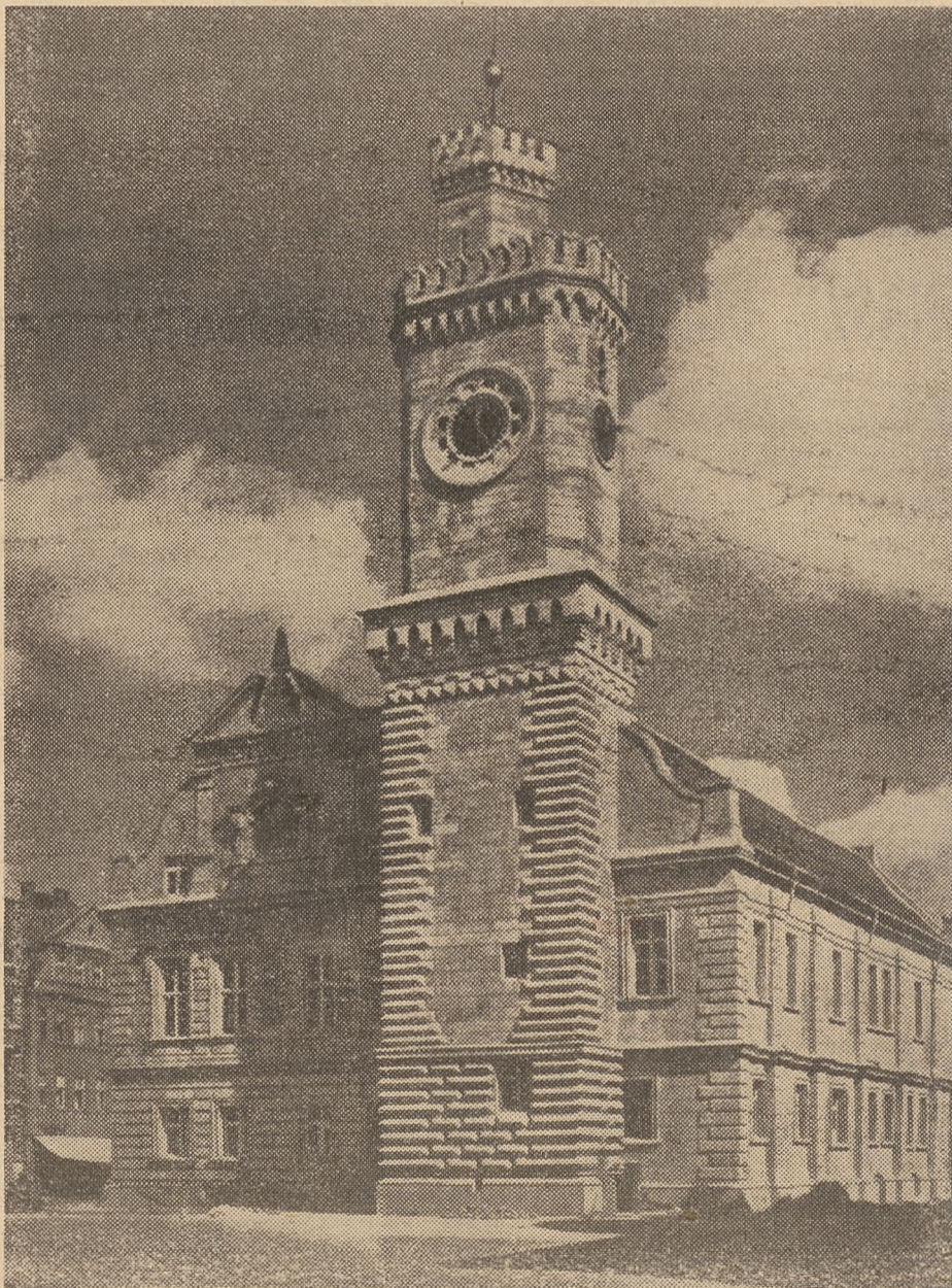
Ratusz w Swiebodzinie (woj. zielonogórska). Pierwotnie gotycki, przebudowany w stylu renesansowym w XVI i XIX wieku. Na parterze i w piwnicach zachowały się jeszcze gotyckie sklepienia.

Poruszyłem zagadnienie egzaminów kwalifikacyjnych, ażeby na podstawie zebranego materiału stwierdzić, że nie jest w tej dziedzinie dobrze. Czy rzeczywiście? — powie czytelnik — przecież „nauczyciel ma prawo składać podanie o dopuszczenie do egzaminu kwalifikacyjnego po raz pierwszy, nie wcześniej niż 3 miesiące przed upływem 2 lat praktyki pedagogicznej i nie później niż 6 miesięcy przed upływem 4 lat”. To prawda. Ale proszę sobie wyobrazić, co będzie po tych czterech latach, jeżeli trzeba będzie przeprowadzić w sposób masowy egzaminy. Co