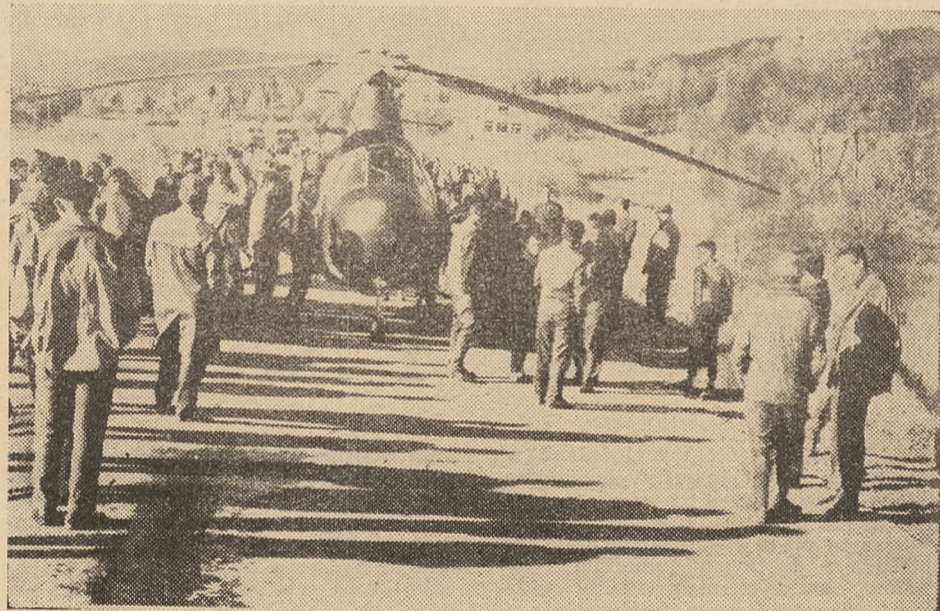
Pomoc Lotniczego Pogotowia Ratowniczego była natychmiastowa.