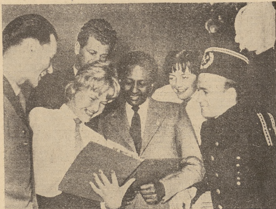
W kulturalnych i Zjazdach ZMS

Rozmowę przeprowadziła: HENRYKA WITALEWSKA