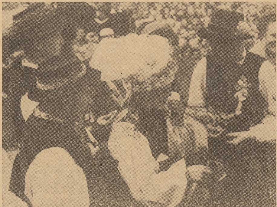
„Wizytówką naszego zespołu było „Wesele Łowickie”

Sąsiad Zabost był więc nie najgorzszym „nauczycielem”. Czy również i on zwrócił Pana uwagę na tańce i pieśni