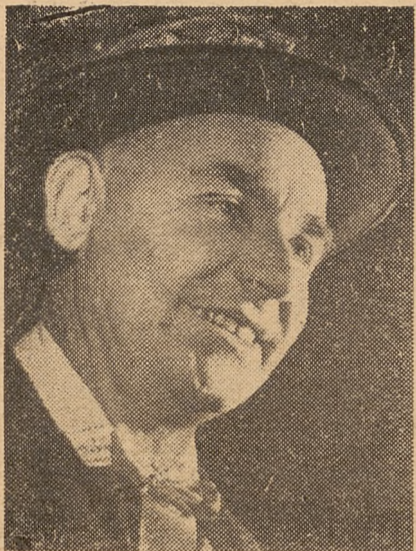
„Bo nie można myśleć po „inteligentku”, a mówić po chłopsku...”

Rozmawiała i notowała: HENRYKA WITALEWSKA