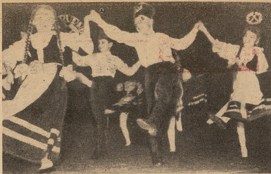
„Zespół ma obecnie w repertuarze 14 tańców

Zespół, jak już wspomniano wcześniej, powstał dwadzieścia lat temu. U genezy jego leżą względy czysto użytkowe. W czterdziestym szóstym, w tych pierwszych latach organizowania życia państwowego, zespół był jednym z magnesów ściągających okoliczną ludność na zebrania, uroczystości. Nie działał wtedy ani teatr objazdowy, ani wybitni artyści nie przyjeżdżali do Szczawnicy na koncerty. Część artystyczna była urządzana przez szkołę. Zadebiutowano przed pełną widownią. Po kilku przedstawieniach nie było