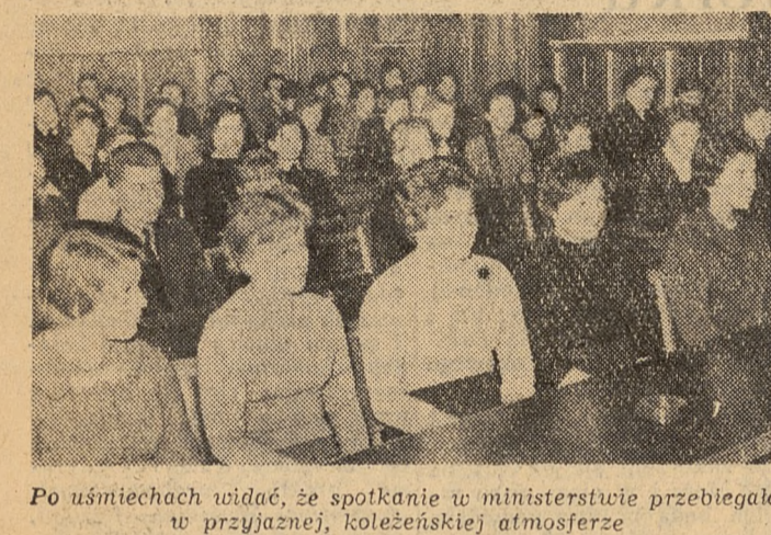
Po uśmiechach widać, że spotkanie w ministerstwie przebiegało w przyjaznej, koleżeńskiej atmosferze