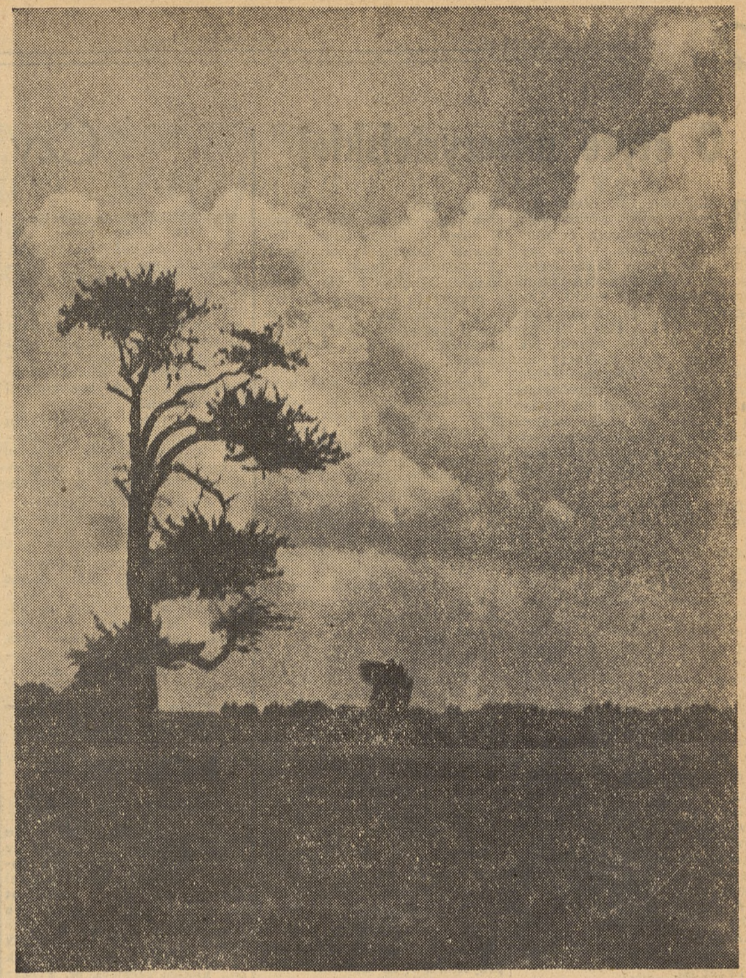
Pejzaż jesienny