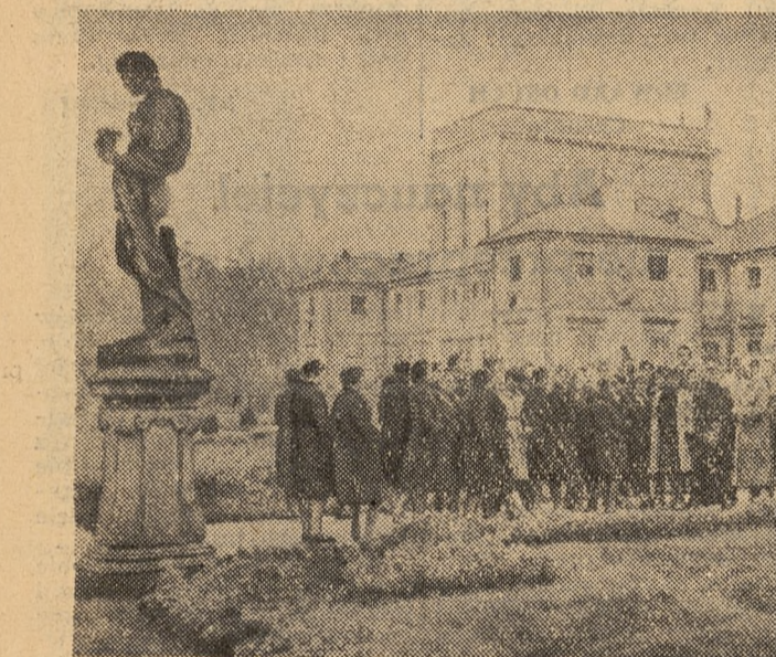
Park wilanowski wita przyszłych pedagogów odnowioną elewacją palacu i najpiękniejszą krasą jesiennych kwiatów i kolorowych liści