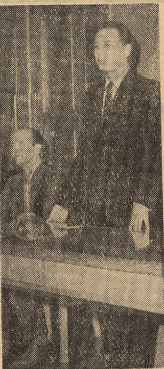
Wiceminister F. Herok wita młodzież licealną