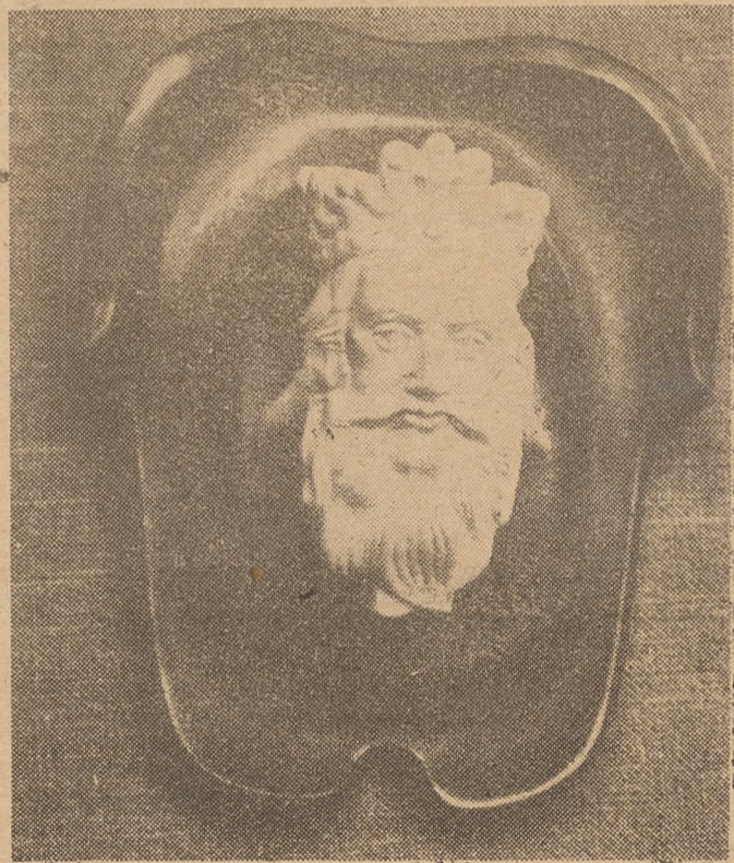
KRÓLOWIE — DLA SZKÓŁ

Józef Czechowicz: ZIMOWE U-ROKI. Ilustr. Z. Bobolowicz. Wydawnictwo Lubelskie 1965; cena 2,50 zł.