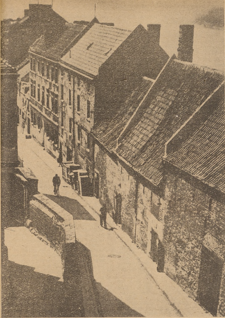
Grudziądz. Fragment ul. Spichrzowej.