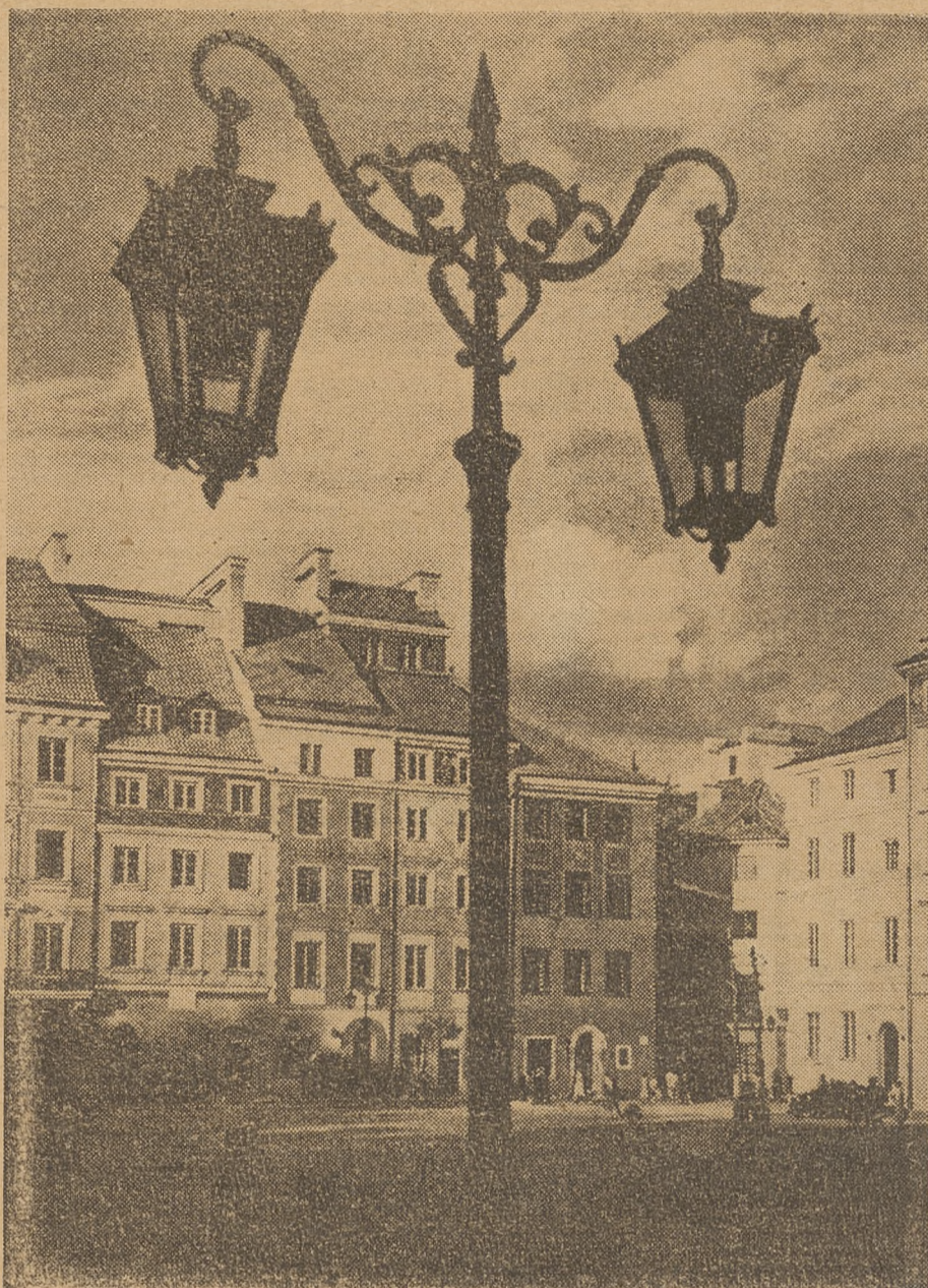
W miesiącu wrześniu urok warszawskiej Starówki przemawia do nas ze szczególną siłą.

Problematyka ta nie jest wystarczająco reprezentowana w programach edukacji kadr pedagogicznych i co więcej jest to problematyka ulegająca ciągłej modyfikacji i zmienności, a więc wymagająca ciągłej, podejmowania przez nauczycielstwo rozpatrywania w kontekście potrzeb własnej pracy społecznej i zawodowej. Braki w zakresie tego typu wiedzy powodują osłabienie efektów złożonej, wielostronne uwarunkowanej pracy dydaktyczno-wychowawczej, której wymogi znacznie wykraczają poza wąskie, przedmiotowo-metodyczne przygotowanie. Praca ta wymaga również całości-