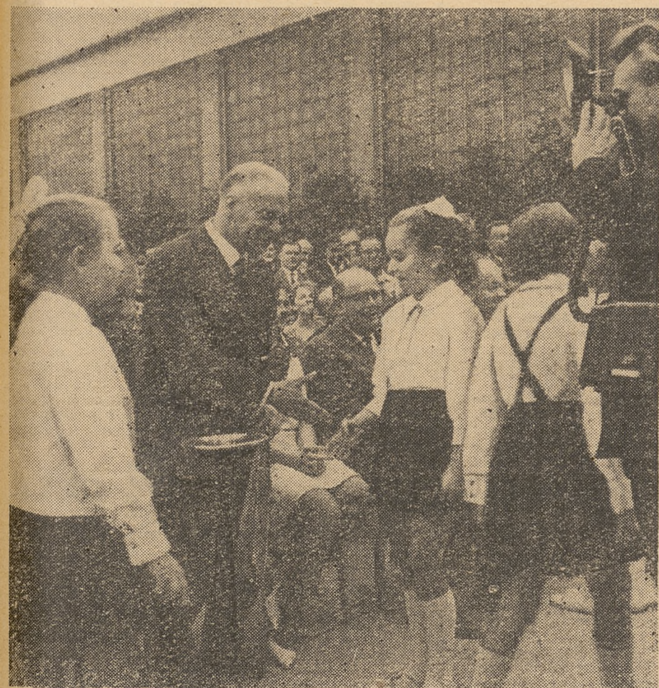
Sekretarz KC PZPR — Witold Jarosiński wśród uczniów tysięcznej 1000-latki.

Niechaj Wam dobrze służy ta szkoła — pomnik ofiarności społecznej i obywatelskiej troski o sprawę oświaty w naszym kraju. Życzę Wam — Pedagogom i Młodzieży — najlepszych wyników w nauce i wielu jasnych chwil spędzonych w tych murach, które wzniesiono w pięknej i szlachetnej kampanii — Tysiąca szkół na Tysiąclecie.