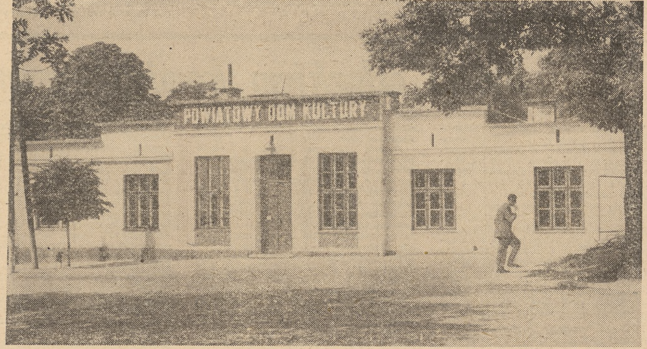
Powiatowy Dom Kultury w Chełmie.