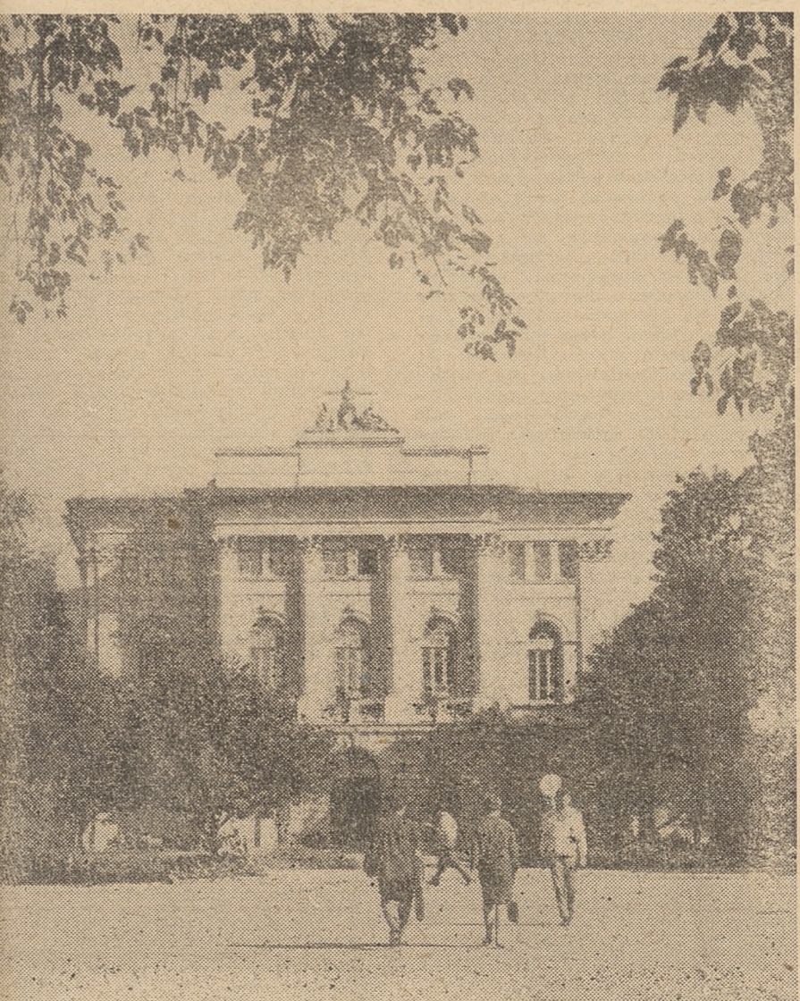
Biblioteka uniwersytecka w Warszawie