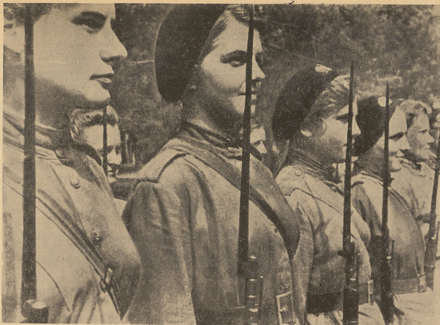
Batalion kobiecy im. E. Piłata