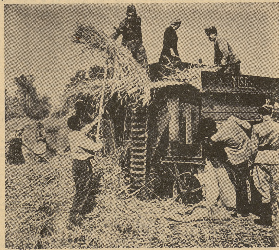
Rokrocznie wielu żołnierzy pomaga rolnikom w pracach polowych

20-lecie Ludowego Wojska Polskiego jest okazją do rozważań nie tylko o sile i opanowaniu, o wysoki jej technice, jaką dysponuje dzisiaj nasza armia. Rocznicą ta staje się ciekawą i jeszcze dlatego, iż Wojsko Polskie łączy swe imię z wieloma czynami społecznymi. Prace społecznie użyteczne, wykonane przez naszych żołnierzy, liczą się dzisiaj na miliardy złotych. Ludziom w mundurach szczególnie dużo do zawdzięczenia ma młodzież szkolna. Wystarczy wspomnieć, że w ciągu ostatnich kilku lat wojsko objęło patronat nad 400 szkołami. Przy czym szkoły, przy których budowie pracowali żołnierze, wyróżniają się wyglądem estetycznym i starannym wyposażeniem wewnątrz.