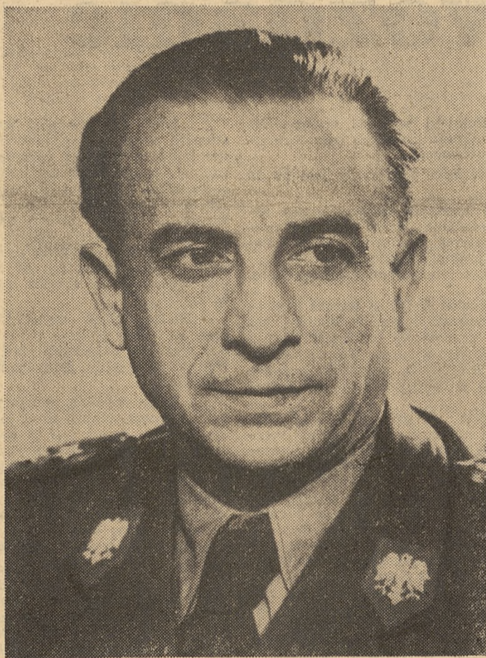
MARSZAŁEK POLSKI TOWARZYSZ MARIAN SPYCHAŁSKI

REDAKTOR: Podstawowym problemem w pracy ideowo-wychowawczej szkoły jest określenie celów wychowania. W jaki sposób można by sprzecyzować w świetle uchwał XIII Plenum, jak również i ustawy sejmowej, idee wychowawcze naszej szkoły?