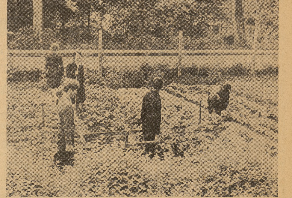
NASZ KONKURS: W szkolnym ogródku

Właśnie życie ludzi, którzy zasłużyli się dla nauki, społeczeństwa i ogólnej kultury, jest chyba bardzo przystępnym urealnianiem ideału postaw. Myślę, że jeśli w ewentualną pustkę ideową młodego chłopca czy dziewczynki zakradnie się przeziębienie o charakterze emocjonalnym lub intelektualnym, ukazujące prawdziwie piękno, budzące podziw i szacunek dla siły woli człowieka i uznanie dla jego społecznego stosunku do życia — to niewątpliwie przyład ten musi podziałać na wyobraźnię i obudzić refleksję. Sceptycznym młodzieży sprawia, że z rezerwą odnosi się ona do fikcyjnych bohaterów literackich i nie tak łatwo ulega