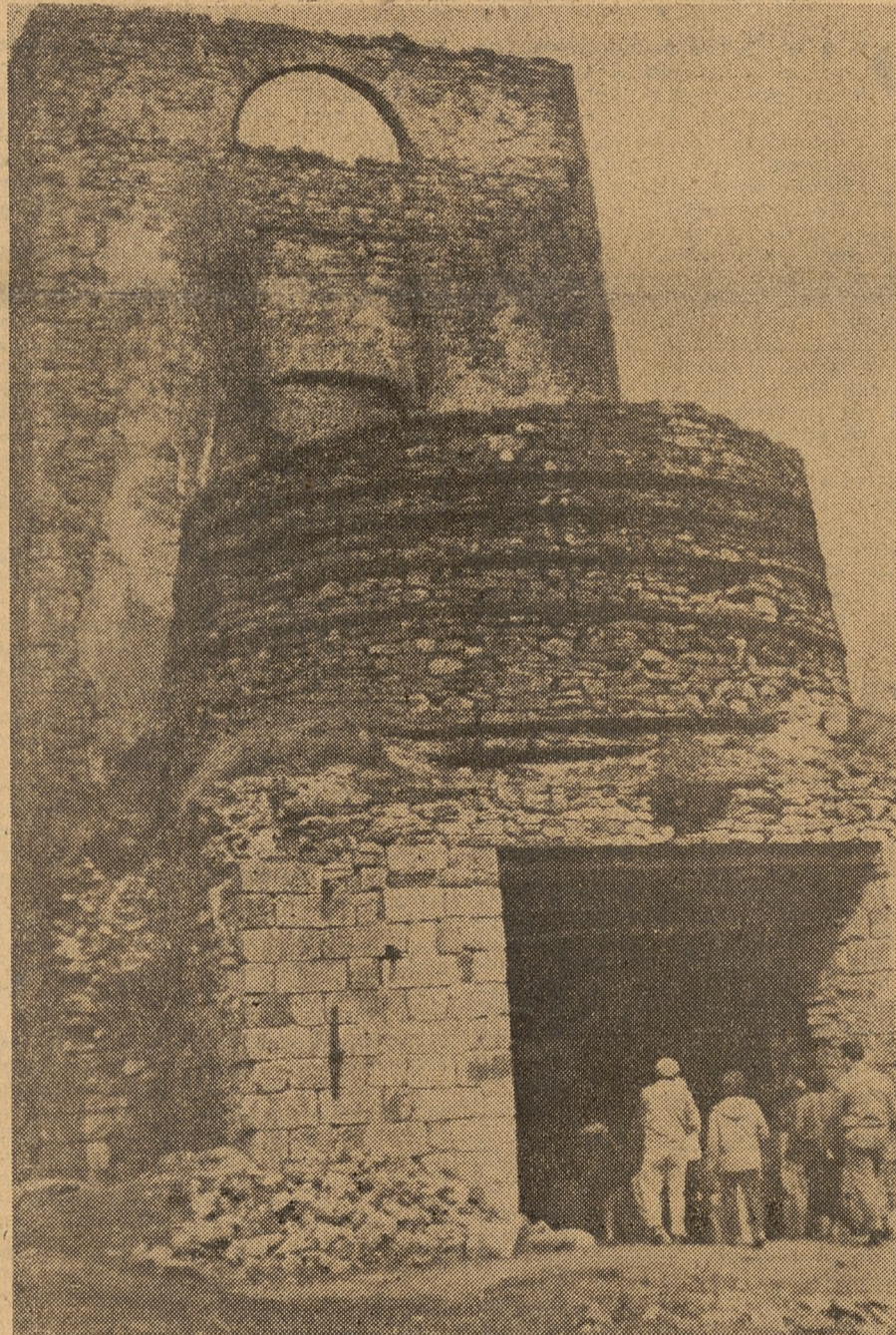
NASZ KONKURS: Ruiny huty z XVII wieku w Samsonowie

J AKOŚ niezwykłe ostro utkwiło mi w pamięci spotkanie z młodzieżą technikum rolniczego w S., jednej z najstarszych i najlepszych szkół tego typu w woj. warszawskim, prowadzonej przez doświadzonego pedagoga, notabene wychowankę tejże szkoły z lat przedwojennych. Nie wymieniam miejscowości ani nazwisk, gdyż niewiele wniósłoby to do sedna trudnych problemów, o które tu chodzi. Są to zresztą, jak sądzę, problemy spotykane w każdej szkole rolniczej i nie tylko chłopskiej, dotyczące kregu tych zasadniczych spraw, które w referacie na XIII Plenum KC sformułowane zostały w zdaniu: „Decydującym ogniwem systemu wychowania młodzieży, kształtowania jej świadomości i socjalistycznych podstaw społeczno-politycznych jest szkoła”.