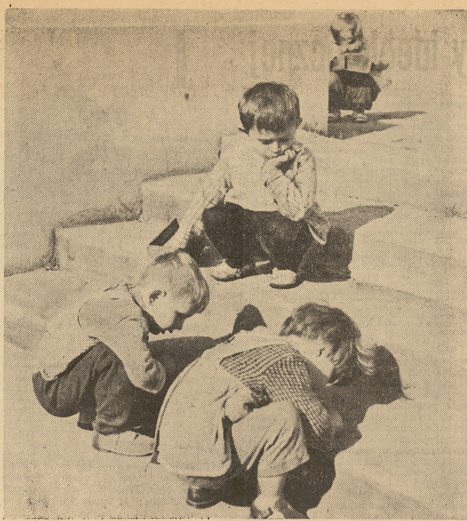
NASZ KONKURS: W krainie fantazji.