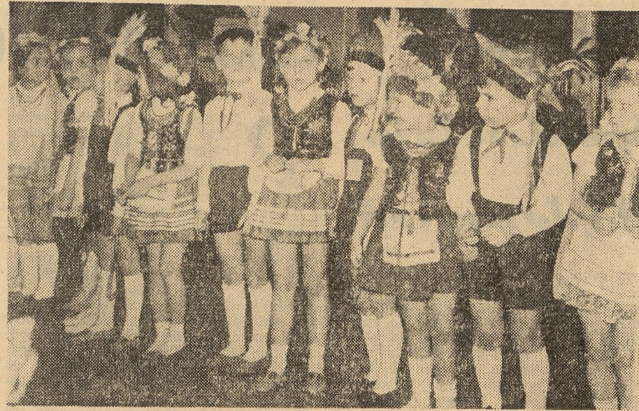
W ub. tygodniu Państwowe Przedszkole nr 61 w Warszawie — Ochota przy ul. Lelechowskiej 7 obchodziło uroczyste czterdziestolecie istnienia. Uroczystości zorganizowały obecności wiceminister wicele D. N. Ochota.