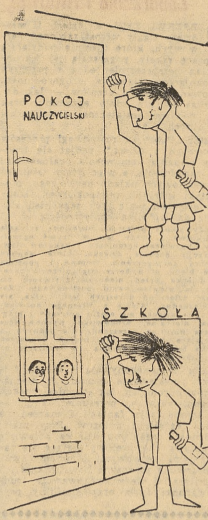
Ja tuś nauczyciel