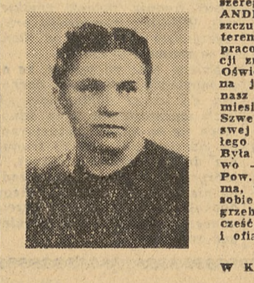
ZARZĄD OGNIWA ZNP W KONSTANTYNOWIE POW. ŁÓDŹ K-365