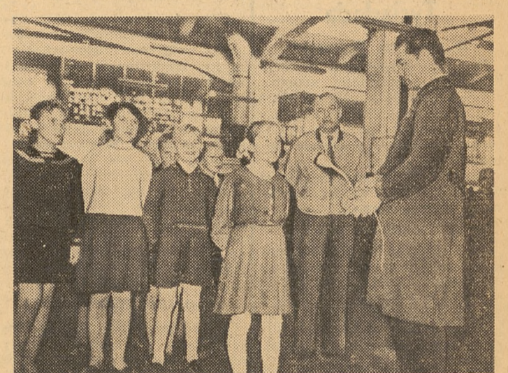
Dzieci pozdrawiają pracowników zebranych w wielkiej hali zakładów.