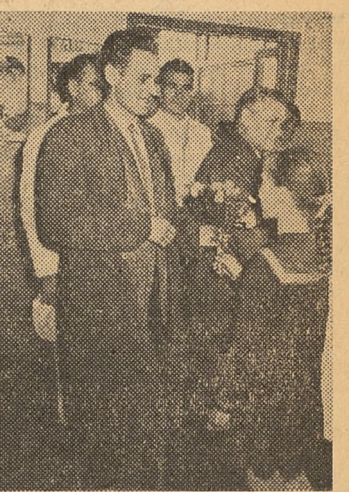
Przewodniczący Rady Robotniczej fabryki „Kopernik” w Toruniu rozmawia z przedstawicielką młodzieży ze Szkoły nr 2.