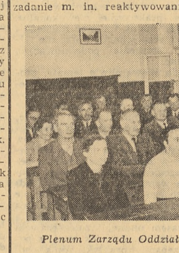
Plenum Zarządu Oddziału ZNP w Sokółce.

W dyskusji posulowano również zrewidowanie norm opalowych, zmianę czasokresu urlopowych, obniżenie kosztów przejazdów na wczasy, zwiększenie zainteresowanie się Związku pracownikami administracji szkolnej i wiele innych.