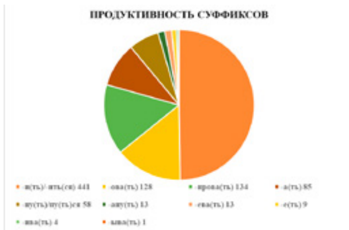
Диаг.1 4

Глагольная база составляет 886 единиц (словарь А.И. Дьякова фиксирует 857, СРЯКЭ – 29 глаголов). Значительное количество глаголов, образованных от англицизмов, представляет собой простые бесприставочные глаголы. 9 суффиксов участвует в их образовании: -и(ть) , -а(ть)/-я(ть) , -е(ть) , -ова(ть) , -ирова(ть) , -ева(ть) , -ану(ть) , -ну(ть) , -ыва(ть) , -ива(ть) . Наиболее продуктивным является суффикс -и(ть) (см. Диаг.1).