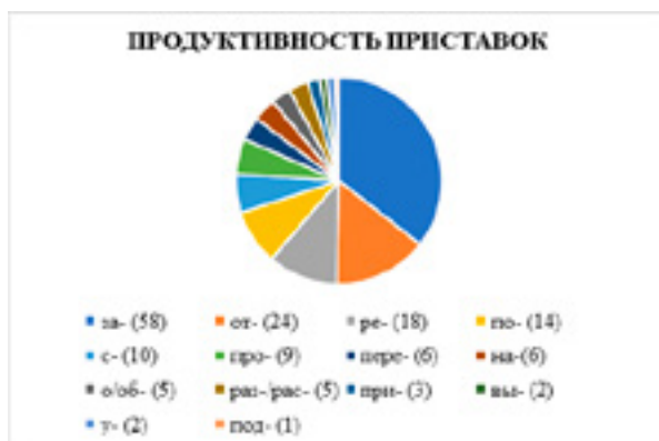
Диаг. 2.

В эмпирическом материале зафиксировано 163 приставочных глагола, образованных с помощью 14 префиксов, т. е. 18 % всех извлеченных глаголов (см. Диаг. 2). Доминирующими являются приставки: за- , от- , ре- .