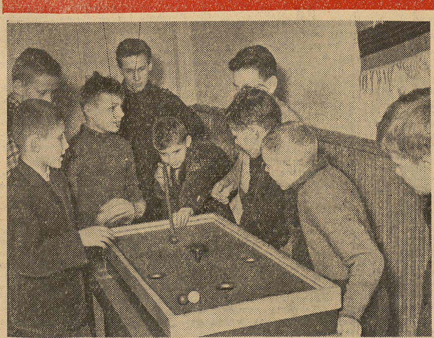
Gdy odwiłz na dworze — bilard szczególnie jest zajmujący.