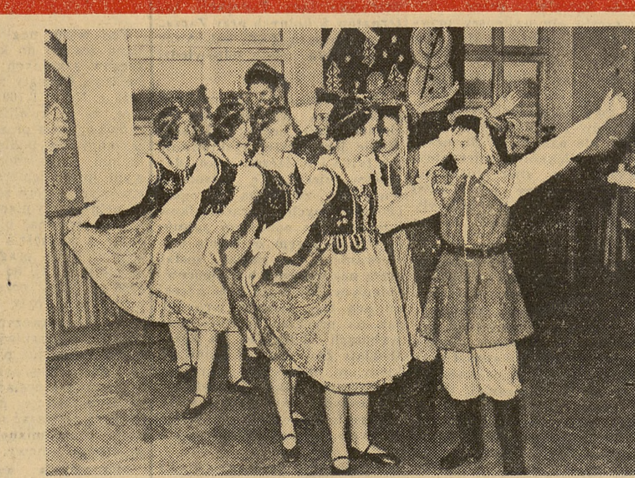
Już wkrótce zatańczymy przy choince.