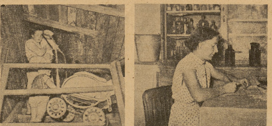
Młodzi ze Starachowic. Oto jak mieszkają tamtejsi nauczyciele. Zdjęcie 1: Nie jest łatwo naszej koleżance z dziećmi wychodzić codziennie z tego pokoju na strychu. Zdjęcie 2: Ta koleżanka nie miała uprzednio w lokalu liczącym 10 metrów kwadratowych...