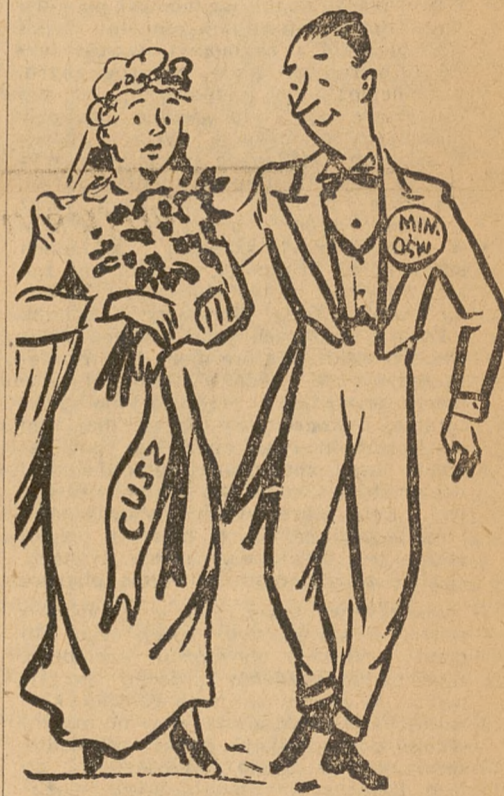
Czy to małżeństwo będzie piodne?

JAKA dokładnie była to pora roku, niestety, nie wiem. W każdym razie moge użyć żelaznych rekwizytów. Była noc. Świecił księżyc, nadawał gorskim gwiazdom barwę, którą na próżno chciałby odwzorować ktoś prócz Chelmońskiego. Rok był tysiąc dziewięćset czterdziesty szósty, a noc, która rozpoczęła wypadki długo przechowywane w pamięci, wcześniej upełnia letniskowy Karpacz.