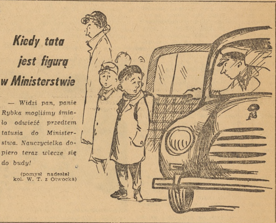
Kiedy tata jest figurą w Ministerstwie

— Widzi pan, panie Rybka mogliśmy śmiało odwiedzić przedtem tatusia do Ministerstwa. Nauczycielka dopiero teraz wlezie się do budy!