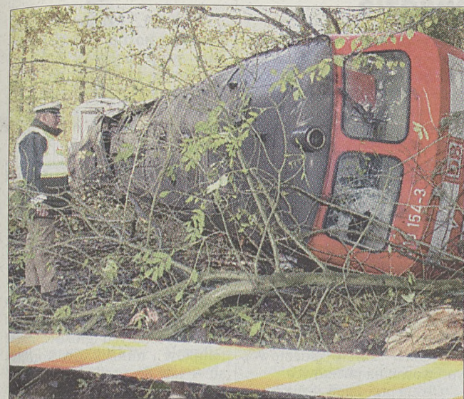
W Niemczech, koło miejscowości Kiel pociąg wypadł z torów.

Aż 35 osób zginęło w ciągu ostatnich trzech dni w Europie, którą nawiedziły huraganowe wiatry i burze. W Niemczech, gdzie prędkość wiatru dochodziła do 183 km na godz., zginęło 10 osób, a siedem ofiar śmiertelnych było w Wielkiej Brytanii, gdzie wiało z prędkością 155 km na godz.