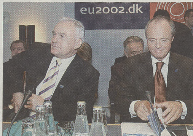
Polski premier Leszek Miller i premier Węgier Peter Medgyessy (z prawej) podczas spotkania z dziennikarzami przed jednodniowym szczytem UE w Kopenhadze.

Polski premier uznał szczyt w Brukseli za sukces, gdyż dzięki zawartym tam ustaleniom stało się możliwe prowa-