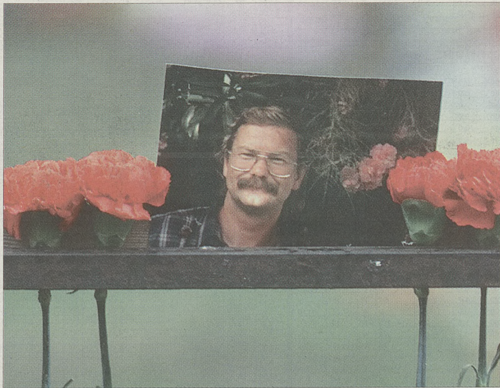
Kwiaty przy fotografii nieżyjącego zakładnika przed teatrem w Moskwie

Tych rozważań i spekulacji dość mają jednak zwykli mieszkańcy Moskwy. Bałaganiarstwo i celowa dezinformacja wprowadzana przez funkcjonariuszy służb specjalnych powodują, iż dziesiątki osób nadal nie mają wiadomości o swoich bliskich.