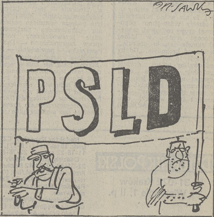
Rys. HENRYK SAWKA