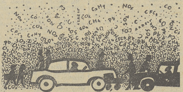
Rys. Mieczysław Górowski

Tlenku węgla jest na al. Krasińskiego kilkakrotnie więcej niż w innych punktach, w których pracują amerykańskie urządzenia pomiarowe. Podobna prawidłowość dotyczy również tlenków azotu oraz węglowodorów. (ar)