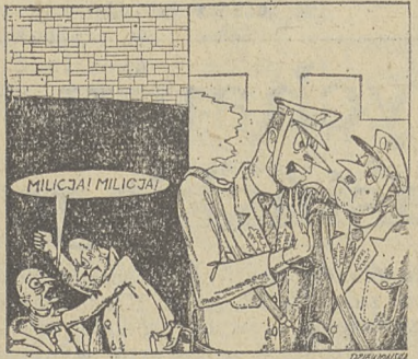
SPOKOJNIE, TO NIE DO NAS, MY POLICJA