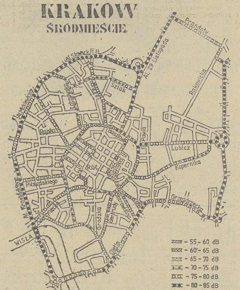
POZIOM DŹWIĘKU HAŁASU KOMUNIKACYJNEGO (wg badań z 1991r.)