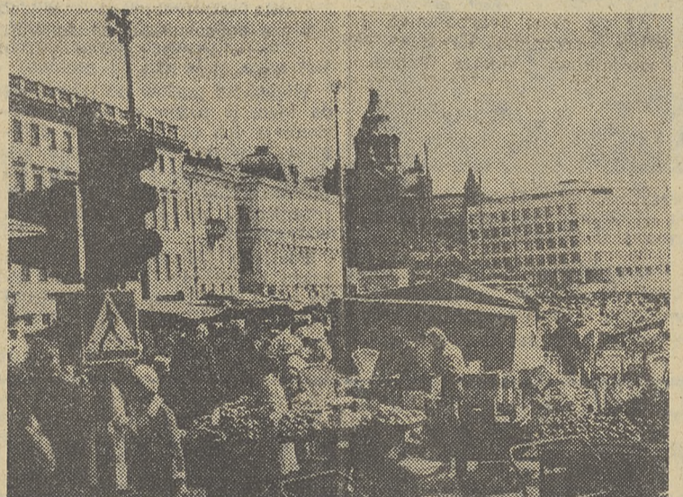
Helsinki — stary rynek i targ miejski.

Obecna słabość wielkiego sąsiada nie powinna skłaniać Finów do arogancji. Weteranów wojny i wypędzonych, którzy domagają się zwrotu Przesmyku Korelskiego, Jeziora Ładoga a nawet Wschodniej Karelii, wzywa się do zachowania rozwagi. Przesmyk uchodzi wciąż jeszcze za bufor przed regionem petersburskim, który oszczędził podczas wojny marszałek Mannerheim, ponieważ zdawał sobie jasno sprawę ze znaczenia starej stolicy imperium także dla czerwonych carów. Taka wiedza w Finlandii się dziedziczy; młodzi