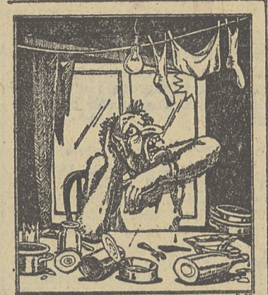
W KONCU WSKAZYKRO TRZEBIA W ZYCIU SPRÓBOWAĆ

Płace w cuglach i bezrobocie. Dla gospodarstw domowych to już syndrom zła. Tylko patrzeć, jak dwa miliony ludzi pozostawiać będzie bez pracy, a bezro-