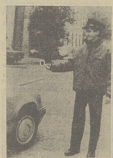
Straż Miejska kontroluje skrupulatnie identyfikatory w strefie „B”, policjanci nakładają mandaty...