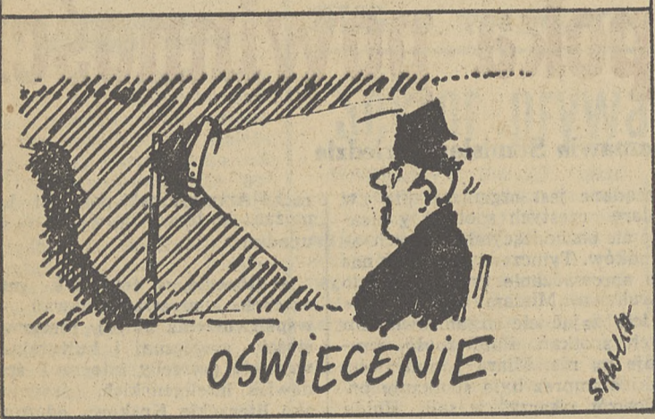
Rys. Henryk Sawka

Obecna sytuacja poligraficzna w kraju wyjątkowo nie sprzyja poezji. Wydawnictwa przestały interesować się zbiorami wierszy, które były jedynie produktem przynoszącym deficyt. Oficyny drukują kryminały, wspomnienia ludzi przesładowanych w tzw. czasach stalinowskich, albumy o Piłsudskim i Katyniu, książkę emigrantów, niekiedy bajeczki dla dzieci. Oczywiście, sprawę upraszczam, ale jest — tym wiele gorzkiej prawdy. Jednym słowem, poezję spycha się do lamusa. Tym większa więc chwała Stowarzyszeniu Promocji Literatury Współczesnej w Rzeszowie, które z powodzeniem wydaje tomiki wierszy, wypełniając tym samym bolesną lukę na księgarskim rynku. Zapotrzebowanie na poezję nie jest — wbrew pozorom — tak małe, przy założeniu jednak, że wiersze zawarte w tomiku będą prezentowały odpowiedni poziom. Spójrzmy więc na owe 5 zbiorów, jakie SPLW do tej pory wydało.