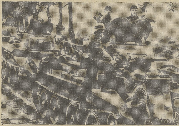
Na linii demarkacyjnej Niemcy żołnierze witały kwiatami sowieckich czołgistów. To zdjęcie jest po raz pierwszy publikowane w polskiej prasie.

Znając wcześniejsze ustalenia niemiecko-radzieckie oraz depesze Schulenburga łatwo można zrozumieć, że argumenty wysunięte w nocy służyły jedynie jako uzasadnienie decyzji, które podjęte były bez względu na rozwój wypadków. Trzeba też podkreślić, że 17 września Warszawa broniła się jeszcze i skapitulowała dopiero w 10 dni później, że w chwili wkroczenia Armii Czerwonej około połowy polskiego terytorium było całkowicie wolne od nieprzyjaciela, że walczyło jeszcze 25 polskich dywizji z 33 zmobilizowanych w chwili wybuchu wojny. O jakim więc rozkładzie państwa można mówić?