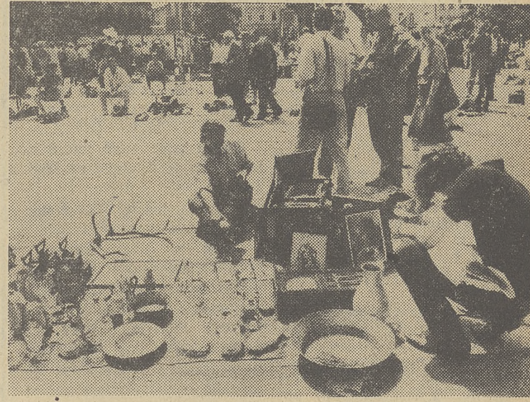
Ostatnie targi kolekcjonerów na Rynku w Krakowie odbiły w niezwykłe pamiętki przeszłości. Niezwykle wysokie były też ceny na większość przedmiotów.