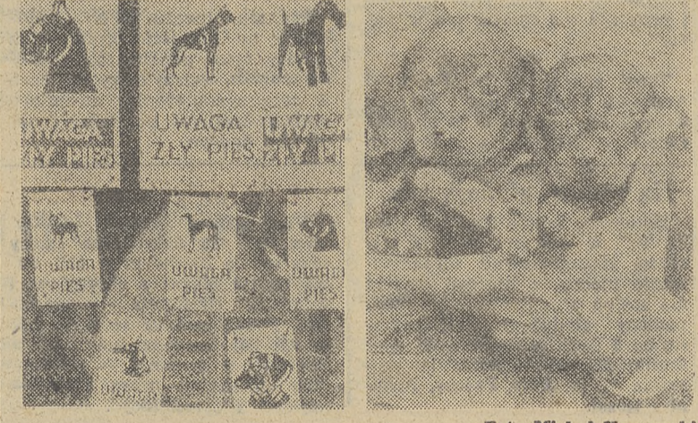
XXVII Krakowska Wystawa Psów Rasowych oraz II Wystawa Wypiółów przyciągnęła wczoraj do Parku Jordana licznych miłośników czworonogów. Nie brakowało przy tym nie tylko psiej gracji, ale i handlowców, którzy oferowali wszystko: maść przeciw psom, zabawki, literaturę, a nawet tabliczki ostrzegawcze „uwaga zły pies”. (MK)