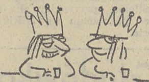
A MOŻE WYPIJEMY KÖNIGSCHAFTA 2

Mocnymi akcentami plastycznymi minionych dni były wer-