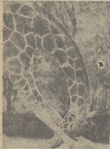
Poranna gimnastyka we frankfurckim ZOO.