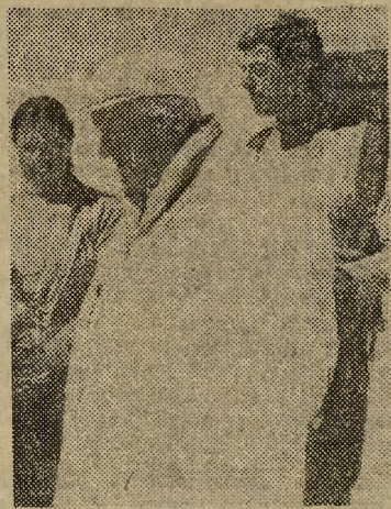
(k) Dopiero po kilku miesiącach opublikowano po raz pierwszy w czasopiśmie „Paris Match” fotografię z krótkiego