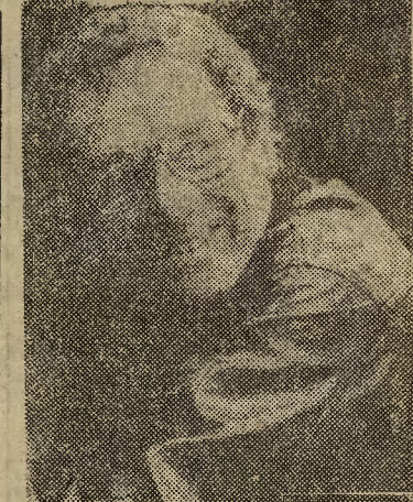
które znają już tylko z historii i opowiadań starszych? („L'Express”)

Od tego czasu wiele się zmieniło: Robert Hossein stał się sławny i bardzo wymagający wobec całego zespołu aktorskiego i technicznego. Przed premierą próby spektaklu trwały po 10, a nawet po 16 godzin, a jego koszt oszacowano na 55 milionów franków francuskich. Ale czy młodszych Francuzów zainteresuje sztuka Frederica Dard o czasach