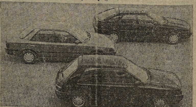
(j) Zmodernizowana „mazda 323” produkowana jest w trzech wersjach. Na pierwszym planie zdjęcia, które prezentujemy „mazda” w wersji miejskiej, później rodzinnej i sportowej. Samochody te wyposażone są w różne silniki, np. o pojemności 1,4 l (67 PS), 1,6 l (84 PS), 1,8 l (57 PS), a także ciekawym nowym 1,9 l (126 PS).