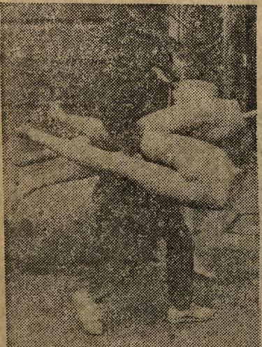
A góry go nie interesują?

20 ub. m. zmarła em. kustosz Biblioteki Jagiellońskiej, zastępcza pracownica m. in. współautorka trzech tomów „Inwentarza Biblioteki Jagiellońskiej”, odznaczona Złotym Krzyżem Zasługi. W jej odejściu Biblioteka Jagiellońska i bibliotekoznawstwo poniosły dotkliwą stratę.