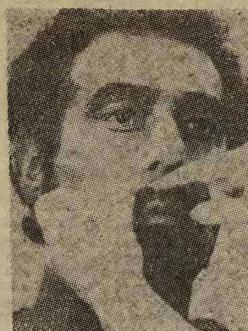
(k) 48-letni Placido Domingo — najslawniejszy i najlepiej zarabiający tenor na świecie nazywany jest „tenorissime”. Jego ojciec był Katalończykiem, matka pochodziła z Kraju Basków. Do-