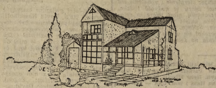
Kubatura domków ma być zróżnicowana, od 110 do 220 metrów kwadratowych a rozwiązania projektowe będą w kilku wariantach. Istnieje też możliwość ich montowania w układzie szeregowym.

piej byłoby je obracać na przedsięwzięcia dające dodatkowe zyski? Czy spółdzielnia nie powinna z góry zakładać wypracowania zysków? Nie, tego nie było wolno. Za to wmawiano opinii publicznej, że przecież narzekania spółdzielni są nieuzasadnione, bo pod inwestycje mają nieskończone kredyty, bo otrzymują uzbrojone tereny. Zapomniano o tym, że gromadzone na książkach mieszkaniowych w PKO środki ludności przynosiły i przyniosą dochód państwu, jeśli tyl-