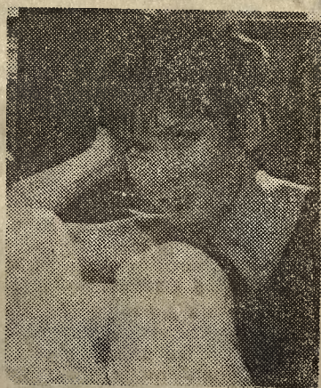
(k) Sabine Azéma — młoda i utalentowana aktorka francuska zagrała pierwszą rolę komiczną

w nowym filmie Gerarda Oury pt. „Vanilla — poziomka”. Sabine Azéma porównują do tak znanych aktorek jak Arletty i Shirley MacLaine. W wywiadzie zamieszczonym w „Paris Match” Sabine powiedziała, że lubi się zmieniać, a wszystko zależy od... fryzury. Kiedy gra w adaptacji sztuki Czechowa nosi perukę z bardzo długich włosów, a gdy potem wraca do swojej krótkiej fryzury staje się zupełnie inną osobą. Chciałaby być równocześnie blondynką, brunetką i rudą, kobietą słodką i złośliwą, a jest to możliwe tylko w filmie lub na scenie. Uważa, że życie jest jak lustro, które odbija promienie słoneczne — trzeba to lustro dobrze ustawić!