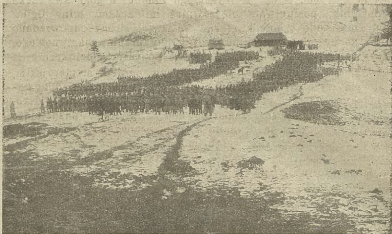
Msza w drugiej brygadzie 25/II X. 1914 r. w Karpatach.