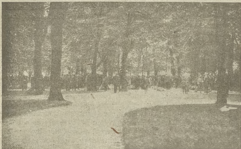
Ochotnicy lwowscy do Legionów w Piotrkowie (1915 r.)