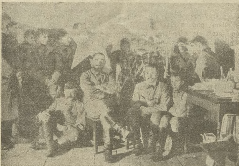
Wieczór wigilijny w pierwszym pułku na Wołyniu w r. 1915.