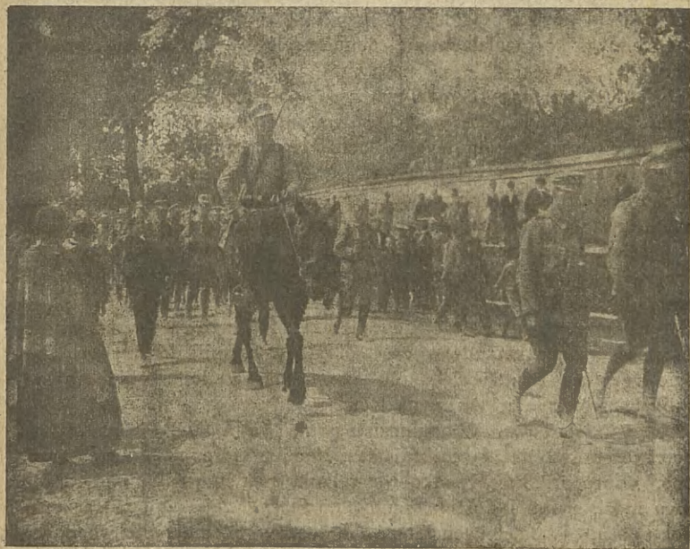
Wkroczenie do Kielc