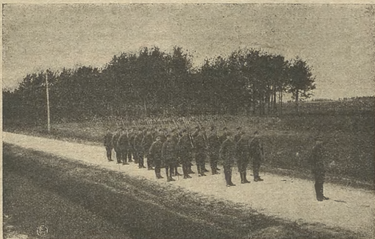
Szkoła podoficerska na ćwiczeniach.