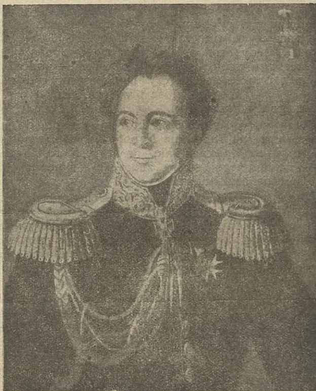
Gen. Ignacy Prądzyński kwatermistrz wojsk polskich w powstaniu 1831 roku.

WIARUS PISMO DLA ŻOŁNIERZY POLSKICH WYDAWANE PRZEZ KOMISYĘ WOJSKOWĄ.