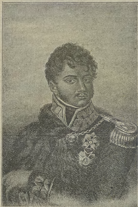
Książę Józef Poniatowski

gnął z zagranicy Księcia Józefa, żeby go przeciwstawić Naczelnikowi. Lecz dzielny Ks. Józef zbyt był uczciwym, ażeby dać się użyć do niecnej intrygi. Z drugiej zaś