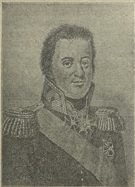
Generał Henryk Dąbrowski