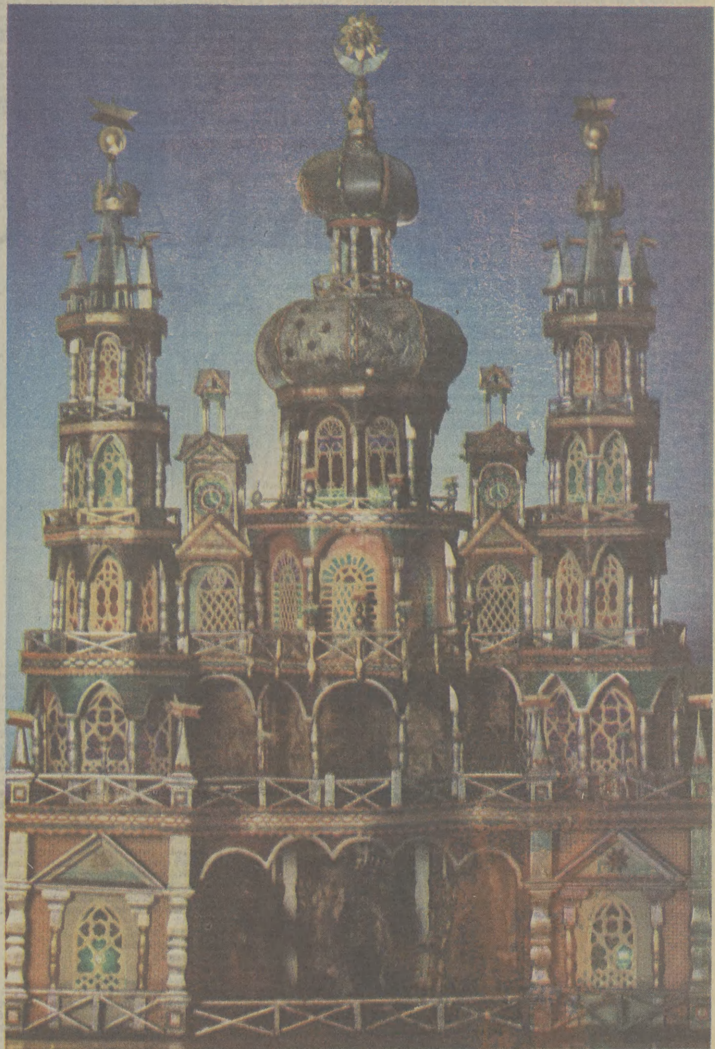
Szopka Michała Ezenekiera znajdująca się obecnie w zbiorach Muzeum Etnograficznego w Krakowie. Na stronie 2 piszemy o premierze widowiska „Szopka Krakowska”, która miała miejsce 23 grudnia 1923 roku w Sali Muzeum Przemysłowego. Miniatury teatru z drewna, tektury i kolorowego szkła był wzorowany konstrukcyjnie na tej klasycznej już szopce mistrza murarskiego z Krowodrzy.

Profesor Zdzisław ŻYGULSKI jr: malarstwo Kossaków to sama esencja polskości