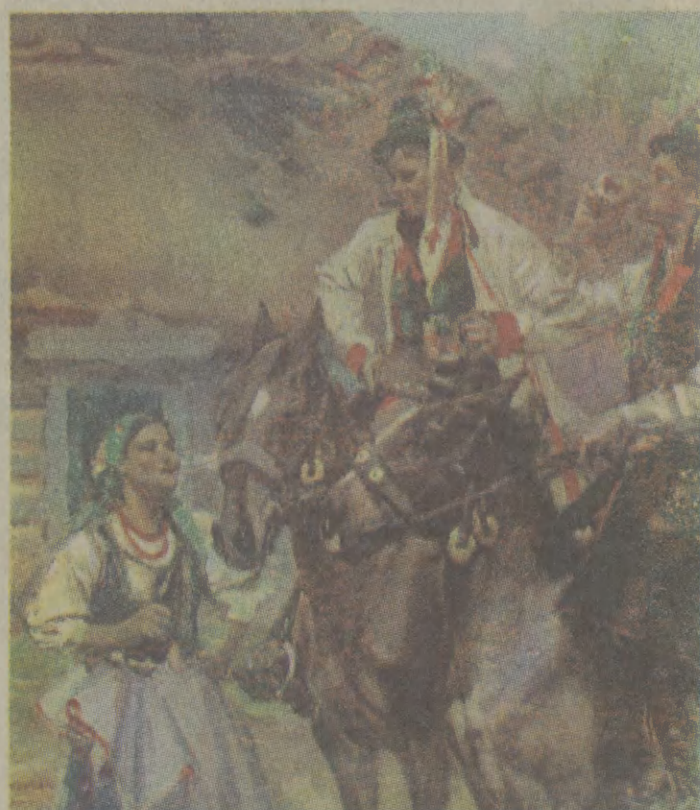
Wojciech Kossak, „Przed karczmą”, nie datowany, wł. Muzeum Historyczne m. Krakowa

Ogiera zatem poznaje się po oczach. Wystarczy stuknąć owo słuchetne zwierzę tam, gdzie powinny znajdować się partie, zwane przez zyczliwych Francuzów les bijoux i wejrzeć koniowi głęboko w oczy. Gdy mu wyleżą na wierzch, znaczy się — ogier. Gdy nie — należy nadal prowadzić badania, najlepiej przy pomocy zidentyfikowanego już ogiera, który sam rozpoznaje kłacza, a kto, nie przymierzając, walcem, zwany w stajennym żargonie kibicem lub z nieznanym przyczyn po prostu szefem. Że zaś w naszym kraju każdy jest we własnym mniemaniu suwerennym panem samego siebie — poruszenie tego tematu zaciętnia i tak już zapewne ciepły nastrój rodzinny świątecznego stołu.