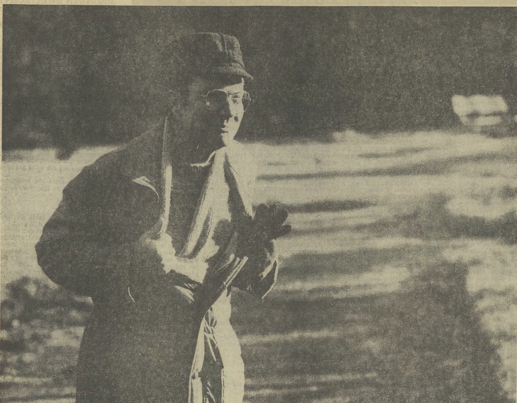
— Ja to serce czuję, słyszę jak pracuje. Jest zupełnie inne od mego starego. Nie potrafię tego opisać, ale jest inne. Może dlatego, że kobiece...