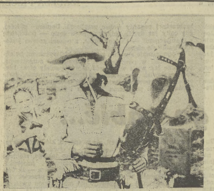
Kadr z filmu „Lemoniadowy Joe”.

Bill wiedział, że ma go zabić... nie wolniejszy, nie miał przywidzeń. Bill rznął z okrwawioną głową między rozrzucone na stole karty... Jest to historia z happy endem, albowiem przed śmiercią Bill zdał opowiedzieć swemu najbliższemu przyjacielowi, do czego doprowadził go alkohol. Przyjaciel ów miał na imię Joe, był znanym na całym Dzikim Zachodzie rewolwerowcem, ale cóż — i on coraz częściej oddawał się konsumpcji wody ognistej i dochodziło już do tego, że szych przeciwników, zamiast w środek czoła, trafiał ze swoich smith-wessonów nad lewą lub prawą brwią. Joe zdawał sobie sprawę ze swej postępującej degrengolady. Stojąc nad ciałem swego najwierniejszego