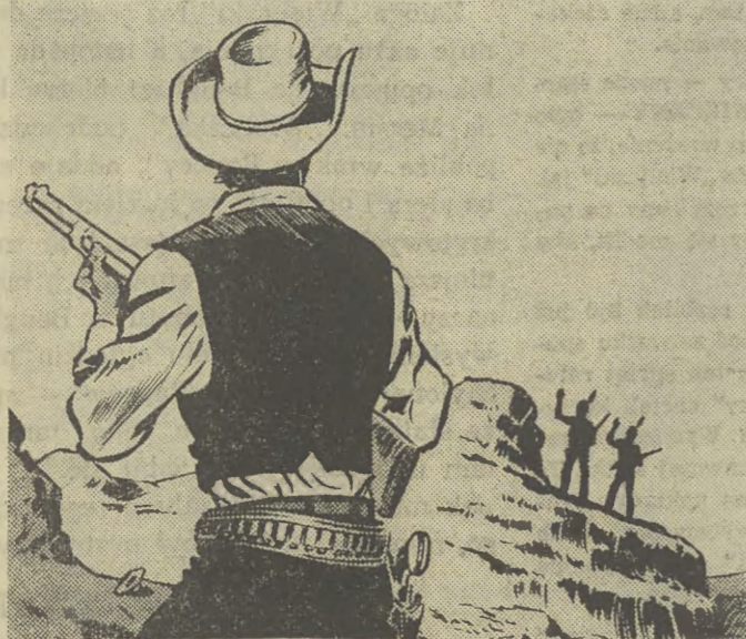
Według komiksów Jerzego Wróblewskiego, Interpress Warszawa 1984.