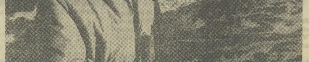
Muszę tu wrócić, ale piechotą...