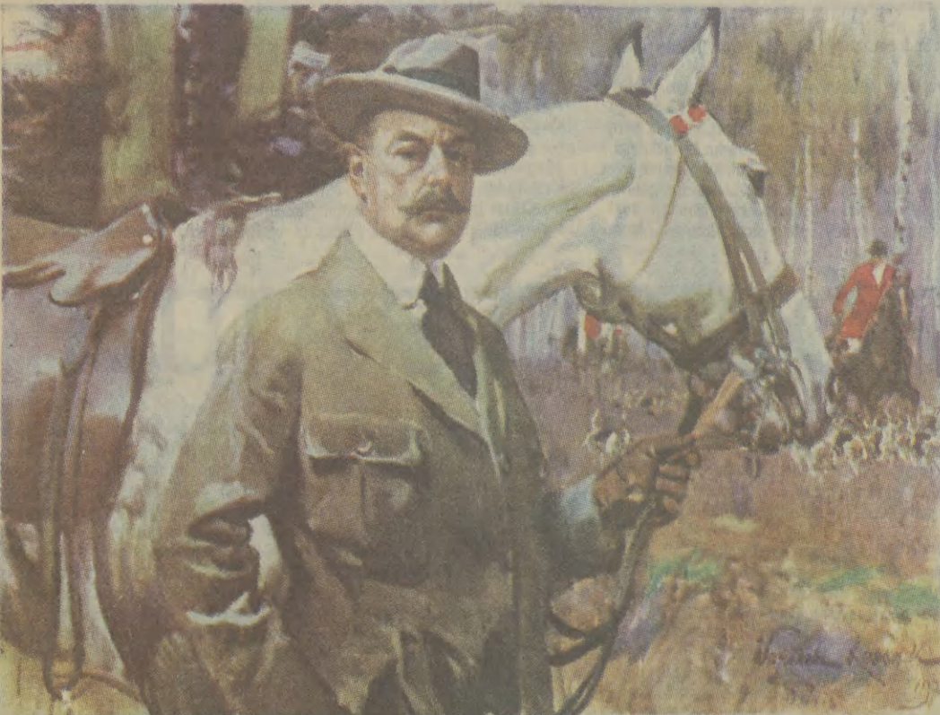
Wojciech Kossak, „Autoportret z koniem na polowaniu”, 1924, wł. Muzeum Narodowe w Warszawie.