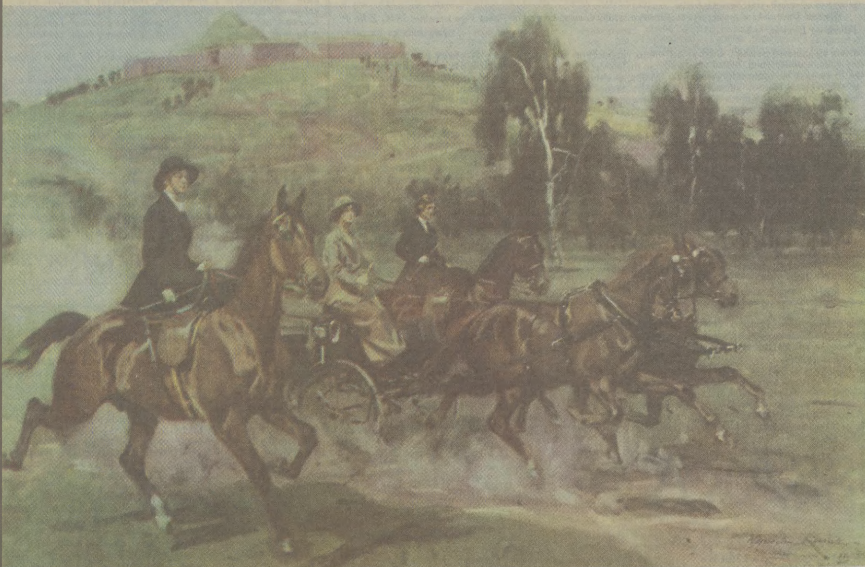
Wojciech Kossak, „Panie Tarnowskie podczas konnej przejażdżki na krakowskich Błoniach”, 1925, wł. Muzeum w Łańcucie.