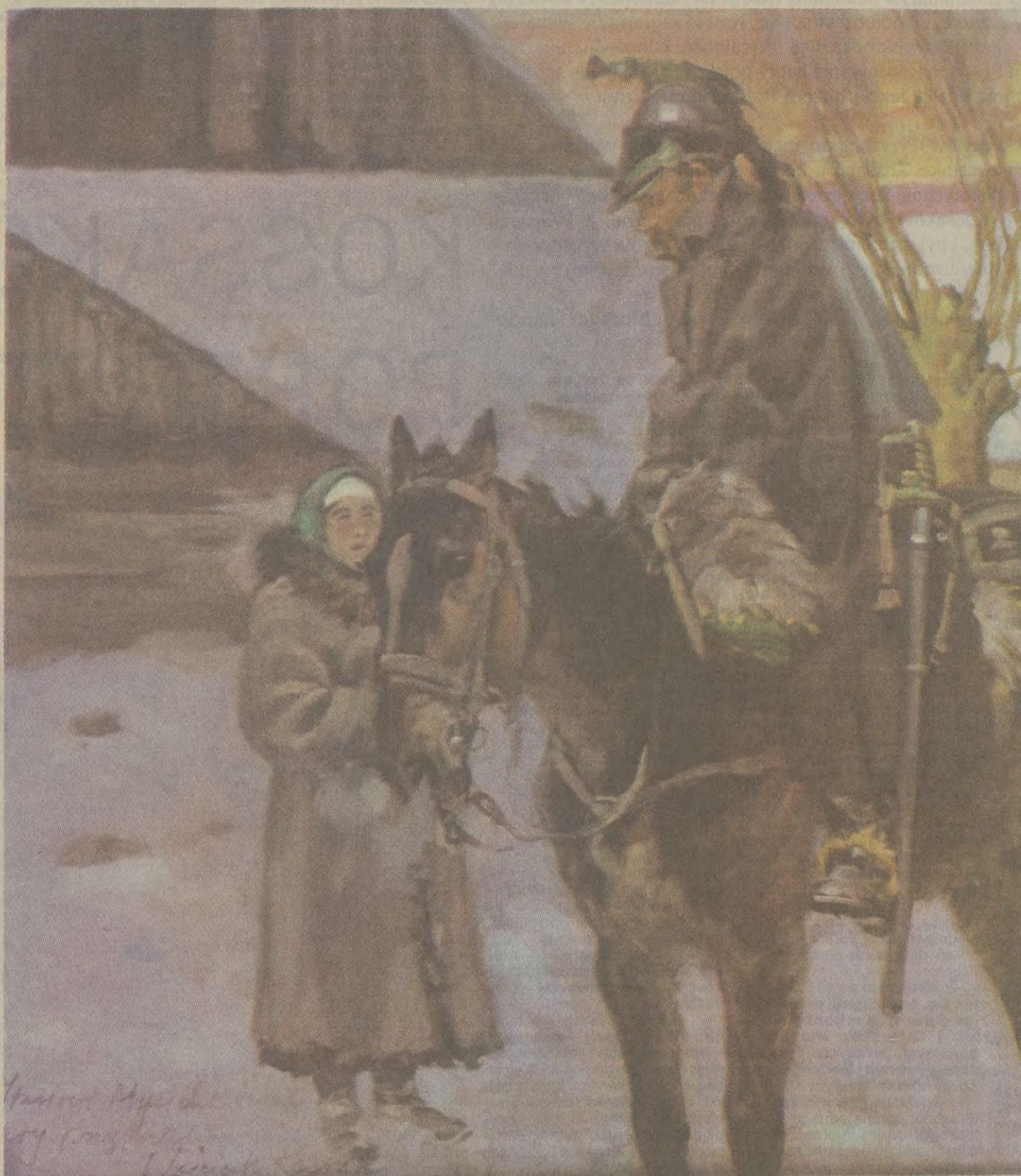
Wojciech Kossak, „Kirasjer francuski i dziewczyna”, 1942, wł. Muzeum Narodowe w Warszawie.